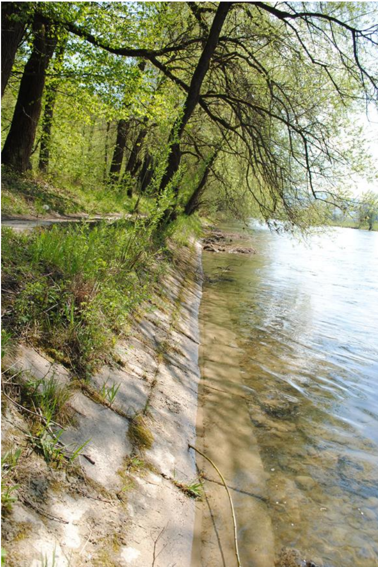
Abb. 5 Die harte Betonverbauung aus der Mitte des 20. Jh. widerspricht den heutigen ökologischen Anforderungen gemäss Gewässerschutzgesetz