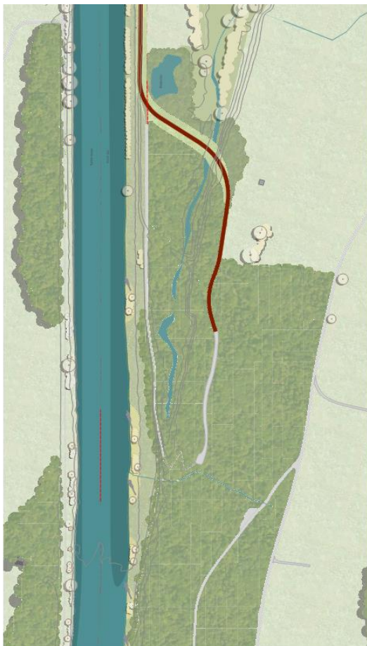
Abb. 1 Südliches Projektgebiet „Rüsshalden“ (Ausschnitt Projektplan Kt. Zug)