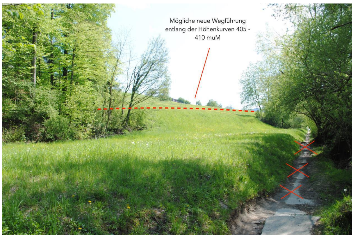
Abb. 9 Visualisierung neuer Wegverlauf (Anschlussbereich Projektperimeter)