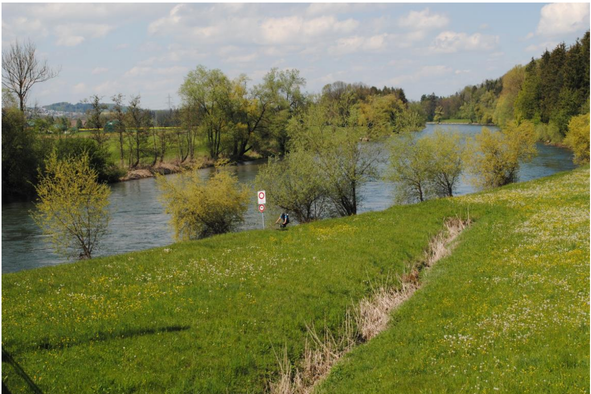
Abb. 4 Fahrverbot wird – mangels Wegalternative - systematisch missachtet. Konflikte mit Fussgänger*innen sind vorprogrammiert