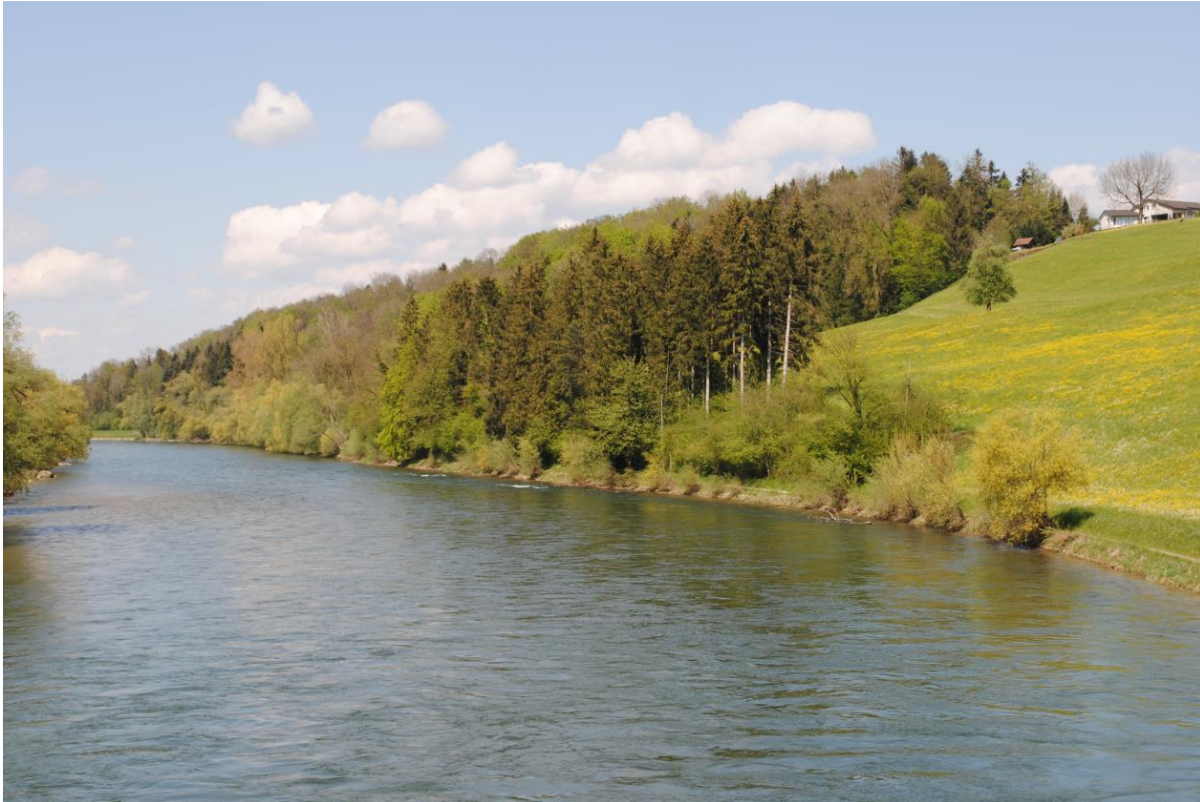
Abb. 10: Die Rüssshalden wirken als Naturdamm

Dank günstigen topografischen Verhältnissen ist eine Renaturierung des fraglichen Reussufers mit minimalem Aufwand möglich. Weil die Rüssshalden in diesem Bereich als Naturdamm (Vgl. Abb 10) wirken, können die bestehenden Betonverbauungen ersatzlos ausgebaut werden. Die eigentliche Renaturierung kann kostengünstig und schonend dem Fluss überlassen werden. Unerwünschte Erosionen sind in diesem Flussabschnitt nicht zu erwarten.