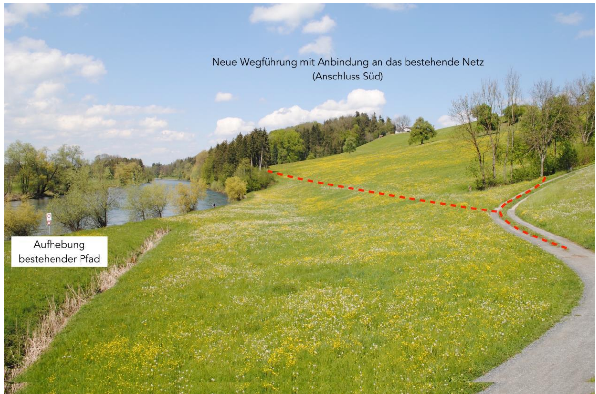
Abb. 8 Visualisierung neuer Wegverlauf (Anschluss Süd)