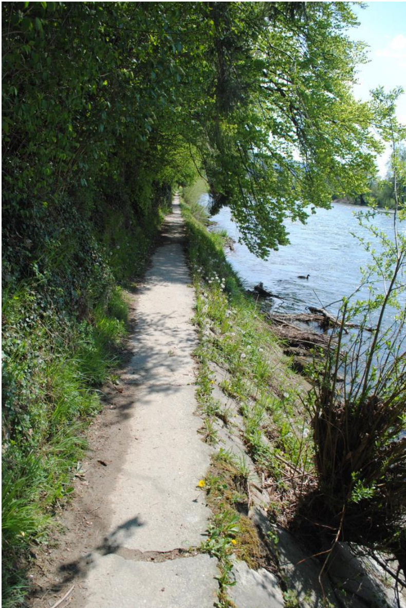
Abb. 2 Heutige Wegführung ist zu schmal und lässt keinen sinnvollen Ausbau zu