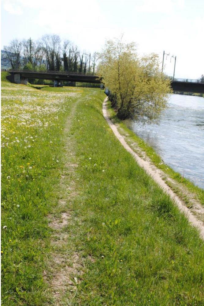
Abb. 3 Die ungenügende Erschliessung führt zu Trampelpfaden im Kulturland (bei Eisenbahnbrücke Meisterswil-Oberrüti)