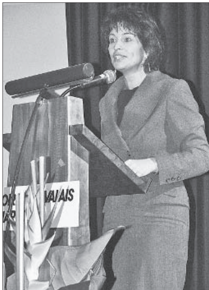
Bundesrätin Leuthard sieht langfristig ein Steigerungspotenzial von bis zu 20 Prozent für die schweizerische Produktivität.

In einer Langzeitprognose sieht Leuthard volkswirtschaftlich gar eine 15- bis 20-prozentige Steigerung der Produktivität und Wettbewerbsfähigkeit der westlichen Wirtschaft via Integration der Frauen in die Wirt-