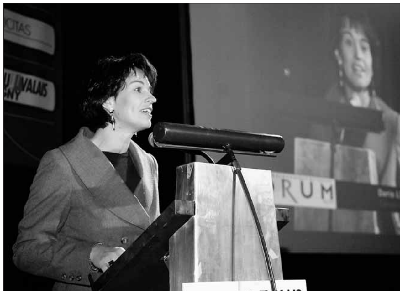
La conseillère fédérale Doris Leuthard: «En 2010, il manquera 25 000 personnes sur le marché du travail. Nous pouvons infléchir cette évolution en augmentant le taux d'activité des femmes.»

FOIRE DU VALAIS ► La conseillère Doris Leuthard affirme que les entreprises