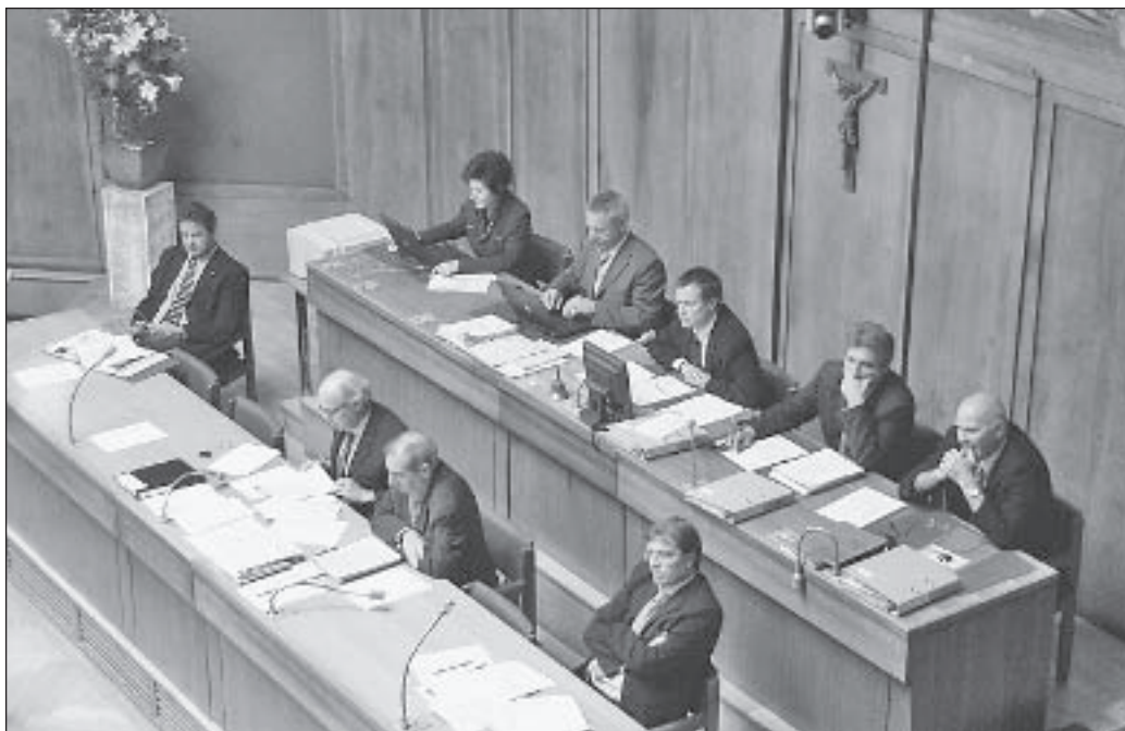
Das Büro des Grossen Rates mit der vorgelagerten Regierungsbank. Der Grosse Rat gab sich gestern in zwei wichtigen Dossiers neue Gesetze.

Auf der Basis dieser Zahlen wurde die Frage der Übergangsfristen für die Versicherten angegangen, die nahe am heutigen ordentlichen Rücktrittsalter stehen. Gegen den Willen der Kommission wurde