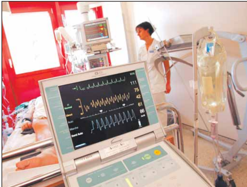
Les conclusions de l'audit de l'Institut universitaire de médecine sociale et préventive de Lausanne sont plutôt favorables au RSV.