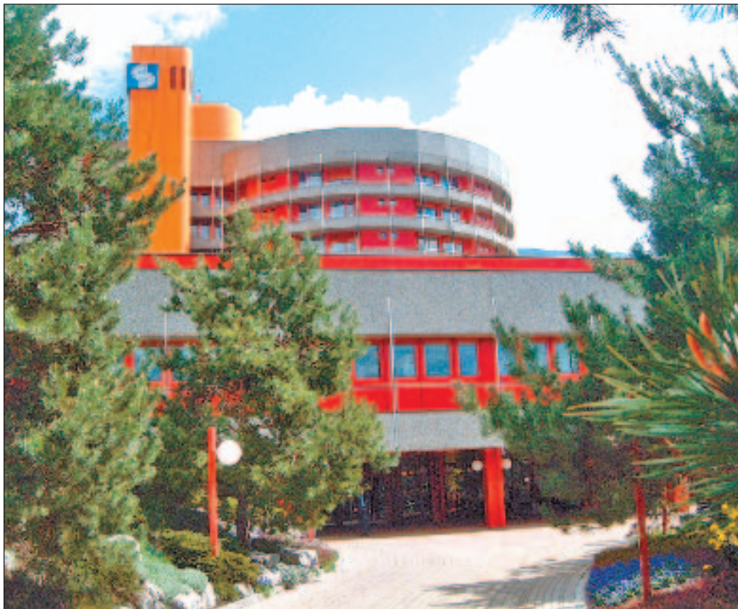
Walliser Spitäler: Gute Noten aus Lausanne.

Das Walliser Parlament wird sich in der kommenden Woche wieder mit dem Gesundheitsnetz Wallis befassen. Seite 5