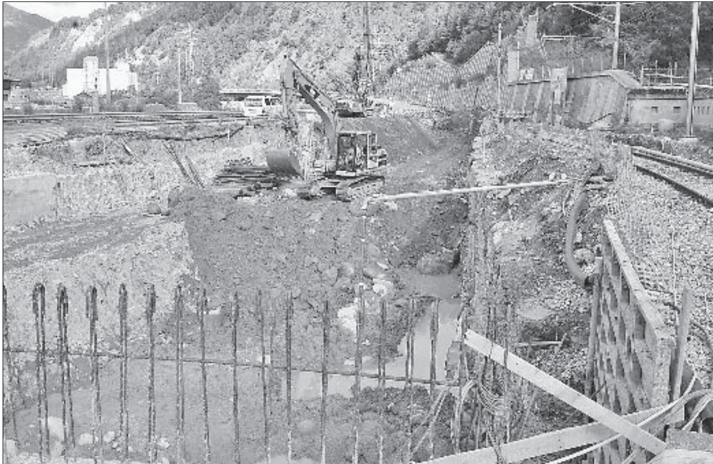
An der Briger Ostausfahrt der Matterhorn Gotthard Bahn wird seit über einem Jahr intensiv gearbeitet. Jetzt beschloss der Grosse Rat die zweite Finanzierungsetappe mit dem Ziel, dass die Ostausfahrt gleichzeitig mit der Eröffnung des Lötschberg-Basistunnels (Dezember 2007) in Betrieb gehen kann.

Notwendig geworden war diese zweite Finanzierungsetappe nicht etwa wegen einer zweiseitigen Salami-Taktik der Behörde, sondern aufgrund der bundespolitischen Entwicklung betreffend die Finanzierung der Eisenbahninfrastruktur. «Bern» hatte die erste Etappe des Projekts über den 8. Bundesrahmenkredit finanziert, der Ende 2006 ausläuft. Die weitere Finanzierung war, bedingt durch den Systemwechsel, stets im Rahmen der Bahnreform 2 geplant, die inzwischen jedoch vom Eidgenössischen Parlament an den Bundesrat zurückgewiesen wurde. Dadurch wurde die Weiterfinanzierung durch einen 9. Rahmenkredit notwendig, der im Sinne von