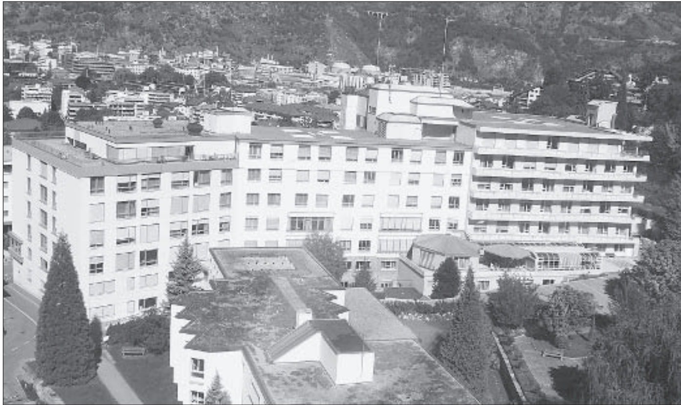
Die Reform gefährdet die Sicherheit der Patienten in den Walliser Spitälern nicht, sagt ein Bericht der Uni Lausanne.

Die Evaluation hat im Herbst 2004 begonnen und dauerte bis Mitte 2006. Das Institut kommt