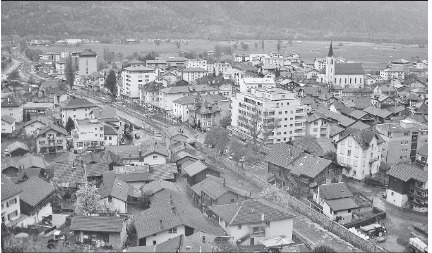
Die Gemeinderatswahlen müssen auch auf Verfassungsebene der Möglichkeit der brieflichen Wahl angepasst werden. Bei dieser Gelegenheit hat sich der Grosse Rat auch Gedanken im Zusammenhang mit der Bestellung der Gemeindebehörden gemacht. So ist das Wahlsystem, die Länge der Amtsdauer und der Zeitpunkt der kommunalen Wahlen zur Sprache gekommen.