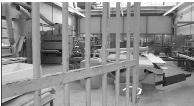
En ouvrant le centre éducatif de Pramont en 2003, le Valais a fait œuvre de pionnier en Suisse romande.