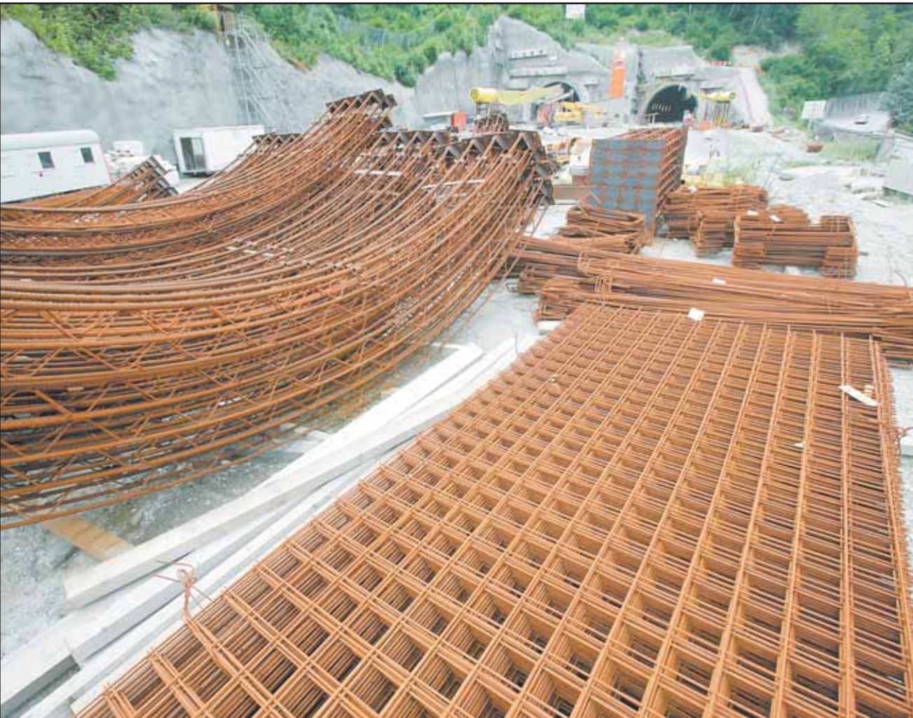
Le chantier du tunnel de Riedberg, scène principale des irrégularités commises sur l'A9

chantiers haut-valaisans de l'A9 n'existe pas ailleurs.