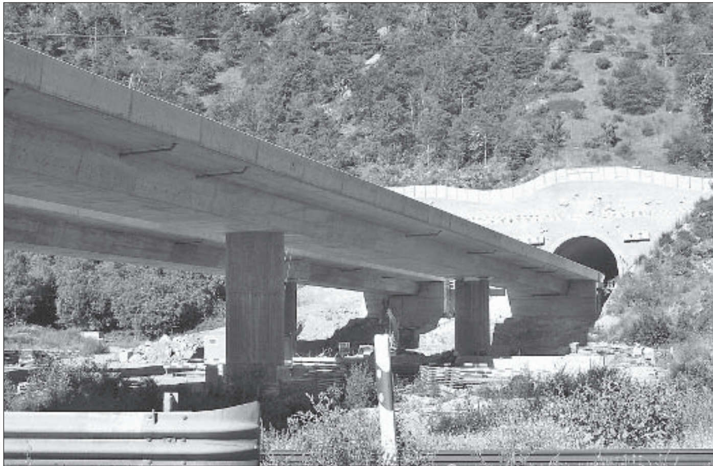
Wie und in welcher Form die Affäre um die unstatthaften Vorauszahlungen im Nationalstrassenbau weiter behandelt wird, hängt auch von der weiteren Entwicklung in einzelnen Dossiers ab. So werden zurzeit neben dem Einschnitt von Eholz auch die Brücken beim Staldbach der A9 näher vom Finanzinspektorat untersucht.