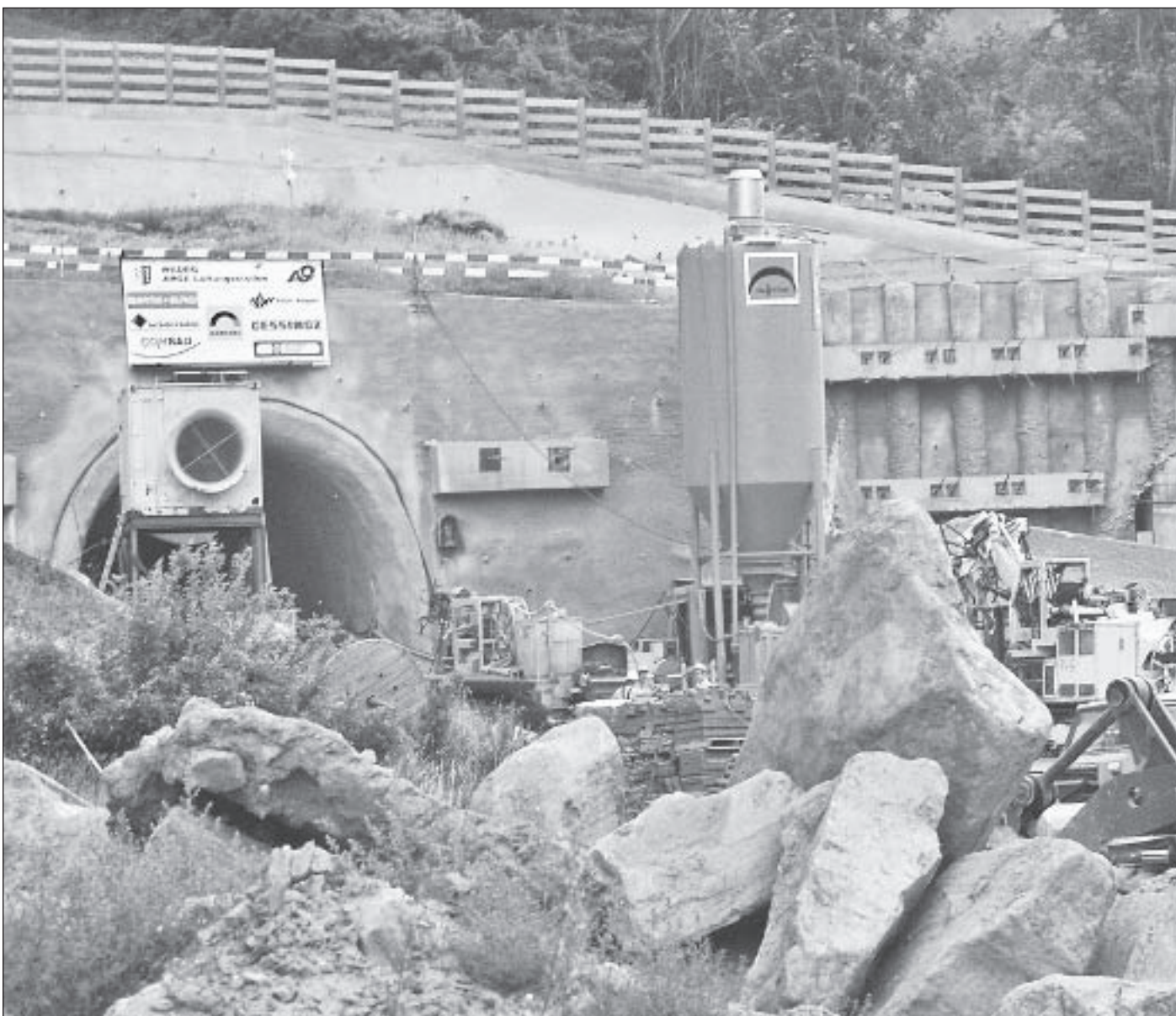
Der Walliser Grosse Rat hat gestern mit 29 zu 93 Stimmen (5 Enthaltungen) die Einsetzung einer PUK zur Untersuchung der Vorgänge im Oberwalliser Nationalstrassenbau abgelehnt. Dies hatte eine Motion der SVP verlangt.