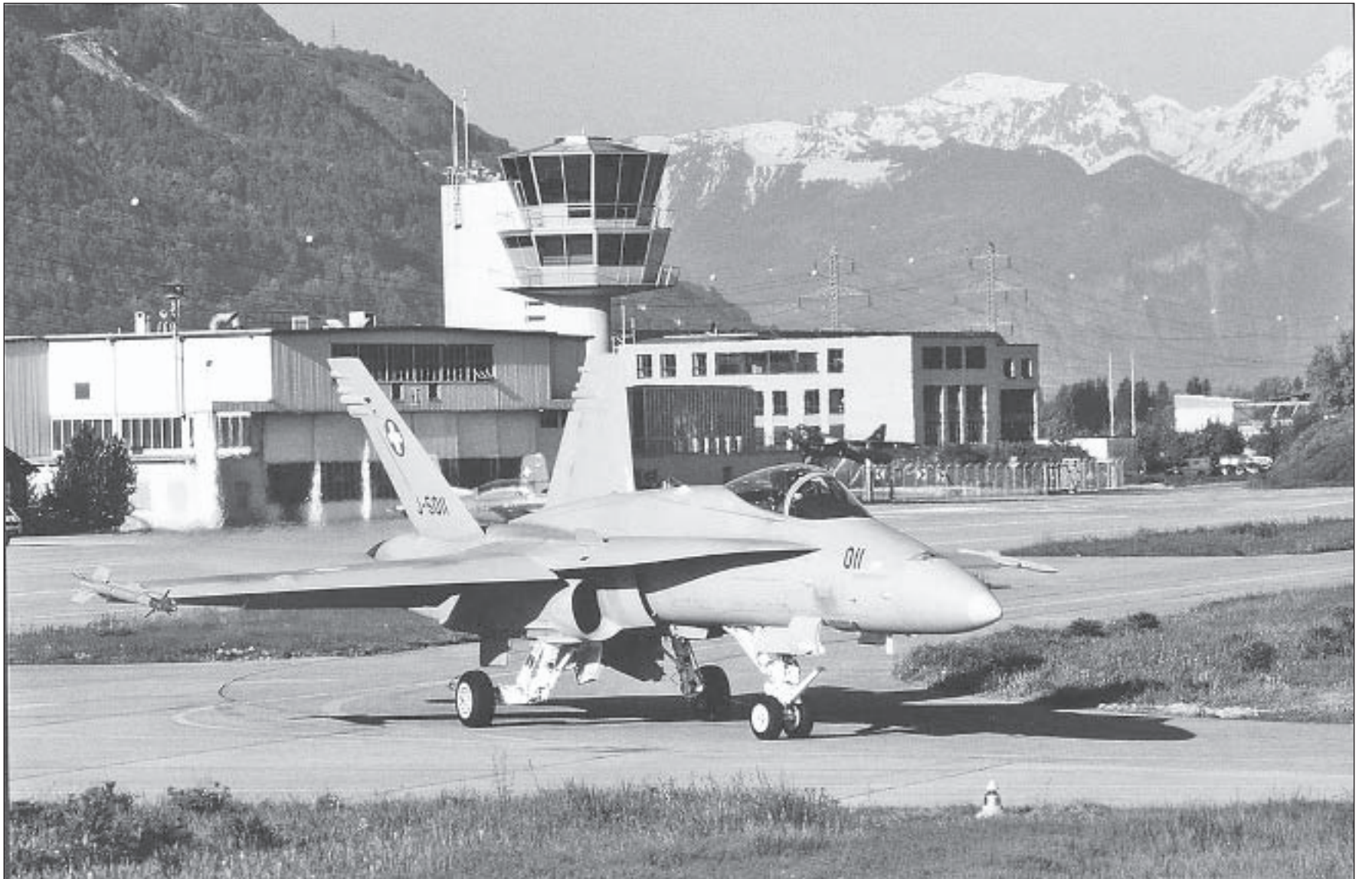
Die Kantonshauptstadt Sitten tut sich nicht leicht mit dem Kriegsflugplatz in ihrer unmittelbaren Nähe. Lärm und orts- wie raumplanerische Einschränkungen sind die Folge.