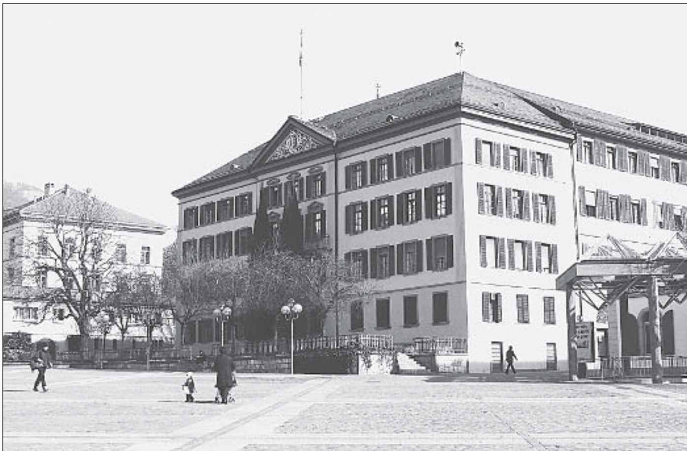
Im Regierungsgebäude in Sitten (unser Bild) wird zurzeit an einem Stabilisierungsprogramm für die Walliser Wirtschaft gearbeitet. Die Regierung dürfte bald schon Einzelheiten dazu bekannt geben.

Nach mehrstündigen Budgetberatungen zu den verschiedenen Departementen drängt sich eine ernüchternde Feststellung auf: Das Kantonsparlament folgte weitgehend den moderaten Sparvorschlägen der Finanzkommission unter Philippe De Preux (freisinnig-liberal). Diesen Anträgen schloss sich mit wenigen Ausnahmen auch die Regierung an. Dort, wo es zu direkten Ausmarchungen zwischen der Regierung und der Finanzkommission kam, setzte sich die Finanzaufsichtskommission des Grossen Rates in den Abstimmungen durch. Praktisch alle Anträge aus dem