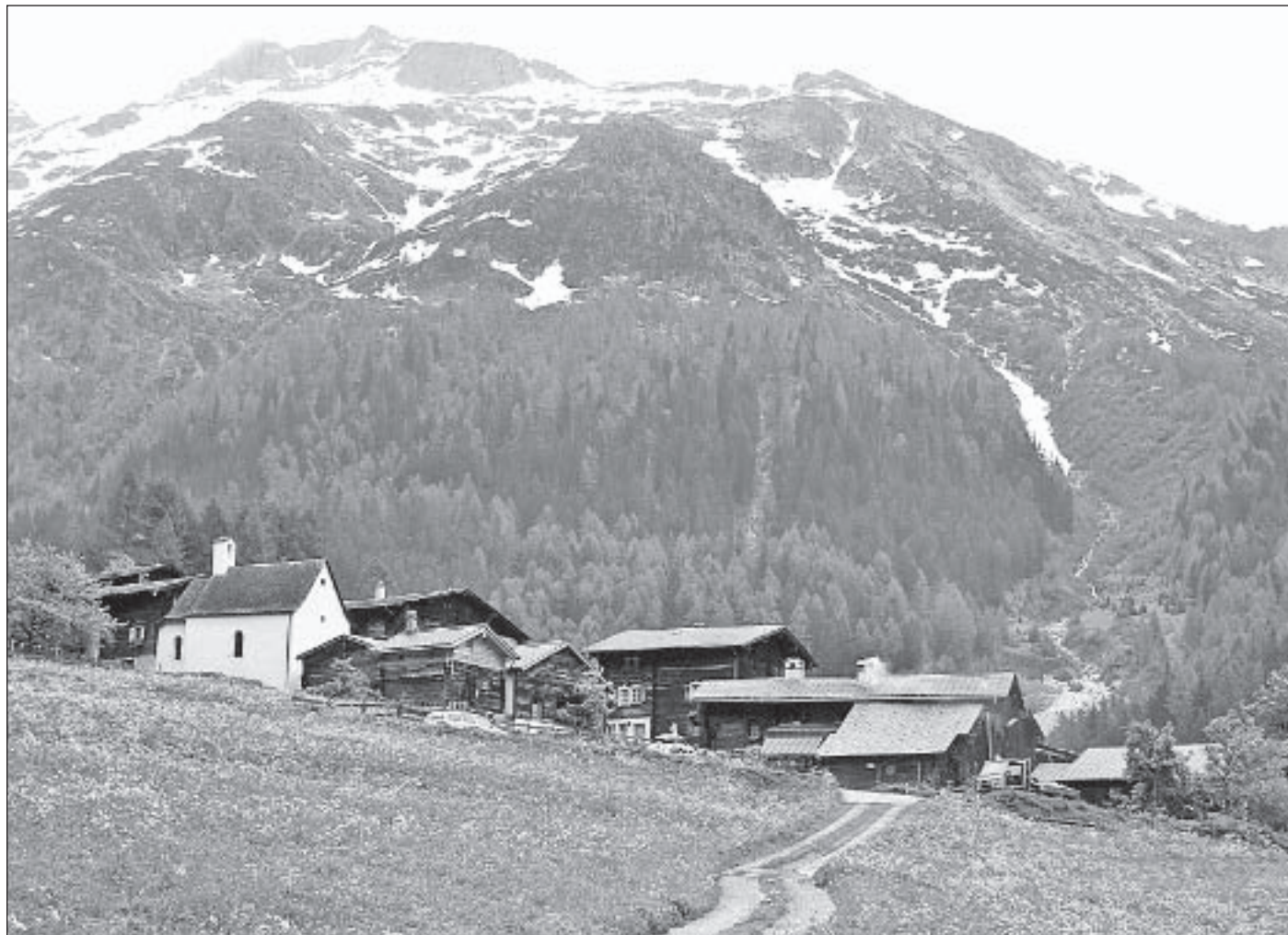
Der Landschaftspark Binntal kann mit kantonalen und eidgenössischen Beiträgen für die Phase der Einrichtung und auch für den Betrieb rechnen.

Fahrzeiten ins Wallis Staatsrat Rey-Bellet befasst sich nach einer Interpellation von German Eyer (SP Oberwallis) mit den Reisezeiten zwischen dem Oberwallis und der Deutschschweiz. Weitere Zeiteinsparungen sind möglich, allerdings hängt das von zusätzlichen Ausbausritten des schweizerischen Schienennetzes ab. Eine Verdichtung des Fahrplanangebots auf der Linie des Lötschberg-Basistunnels stellt eine weitere wichtige Zielsetzung dar. Der Bahnhof von Visp ist ein Vollknoten, der zur Zufriedenheit funktioniert. Weitere Verbesserungen sind möglich, bedingen aber Investitionen wie ein viertes Geleise ab dem Basistunnel. Die Direktverbindung Sitten–Bern bleibt auch ein Fernziel, dies erfordert den Ausbau