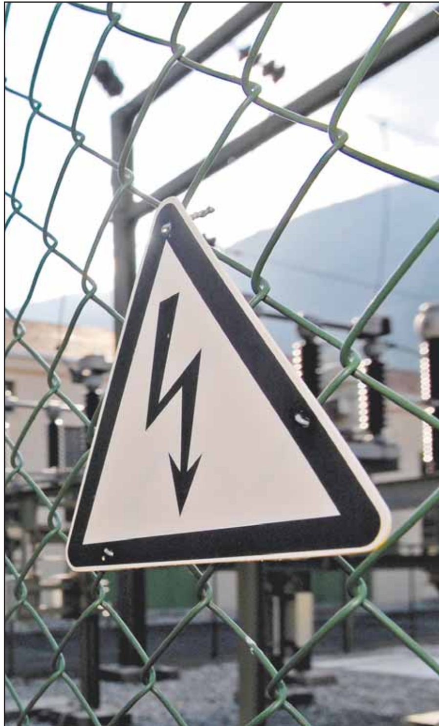
Une infime partie de votre future facture d'électricité se jouera vendredi devant le Parlement. HOFMANN

Ce décret entend aussi apporter un peu plus de transparence dans le calcul des tarifs. «C'est après avoir reçu trois représentants des 66 sociétés de distribution acti-