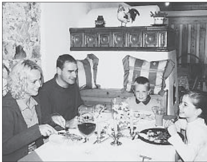
Der Grosse Rat hat beschlossen, die Steuern für rund 40000 Walliser Familien mit Kindern, die nur über kleine und mittlere Einkommen verfügen, spürbar zu verringern.

Der Rat behandelt die Teilrevision des Steuergesetzes, die der Entlastung der bescheidenen und mittleren Einkommen dient. Der Kanton verzichtet auf rund 30 Mio. Franken an Einnahmen, die Gemeinden auf 28