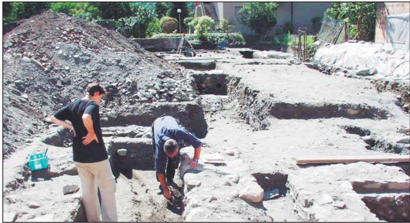
L'archéologie restera en 2009 un parent pauvre, au grand dam de la gauche.