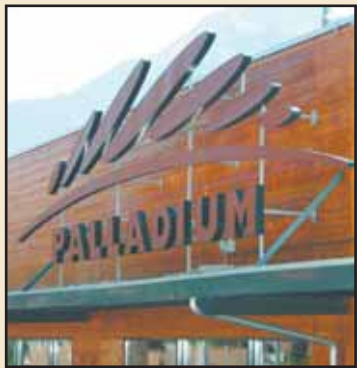
A Champéry. LE NOUVELLISTE