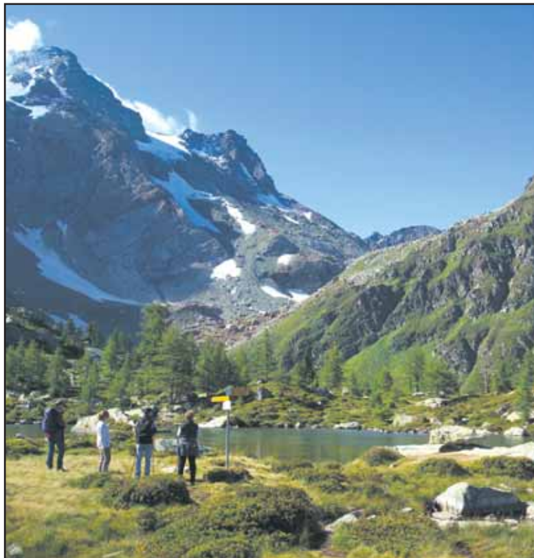
Le Parlement valaisan s'est montré enthousiaste à l'idée d'aider financièrement le Binntal à devenir un parc naturel régional. GOMS TOURISMUS

En 1977 le Binntal avait été inscrit à l'inventaire fédéral des paysages, sites et monuments d'importance nationale. PG