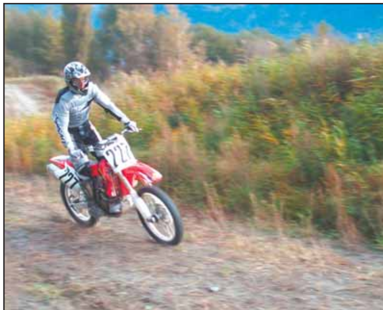
Les motos tourneront-elles à nouveau en 2009 au Verney?

Sacré casse-tête! Le dossier de la piste du Verney est un sacré casse-tête. Ces dernières années, les procédures se sont multipliées, impliquant différents acteurs, comme la commune de Martigny bien sûr, l'Etat du Valais, le WWF, Pro Natura