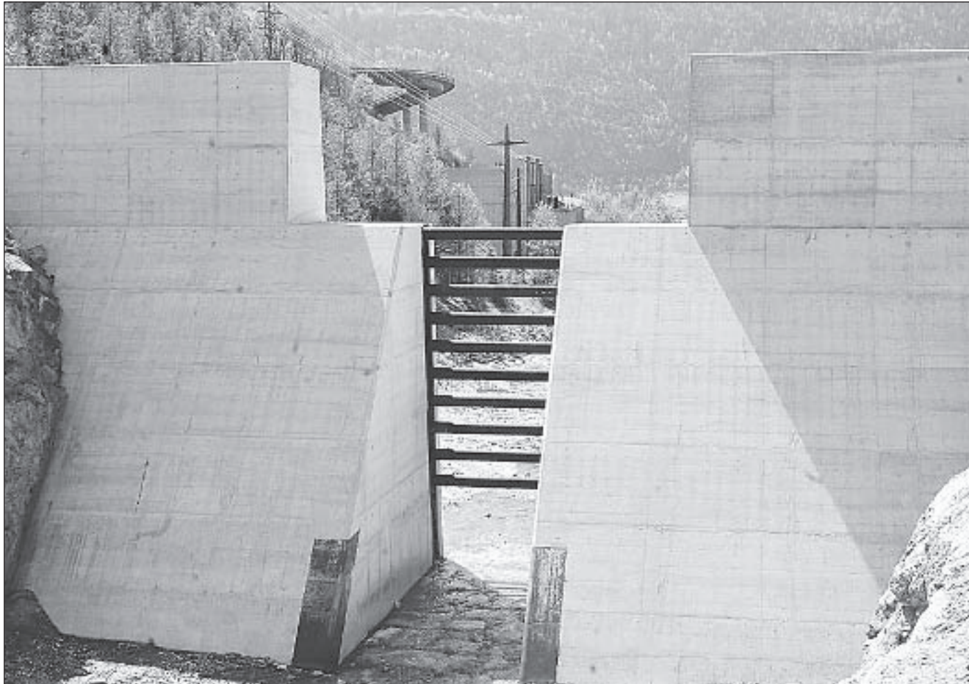
Bei Wasserbauprojekten soll es zu keiner Mehrbelastung von Gemeinden kommen. Der Kanton springt für verringerte Subventionsansätze des Bundes in die Lücke.

In beiden Ortschaften übersteigt der Lärm des regen Verkehrs die Grenzwerte der Lärmschutzverordnung oder erreicht sogar Alarmwerte. Lärm-mindernde Beläge, verkehrsberuhigende und bauliche Massnahmen sollen eine Verbesserung der Situation herbeiführen. Darunter fallen auch Geschwindigkeitsbegrenzungen und der Einbau von Schwellen innerorts. Von radikaler Seite werden Bedenken laut: Verkehrsberuhigende Massnahmen führen dazu, dass