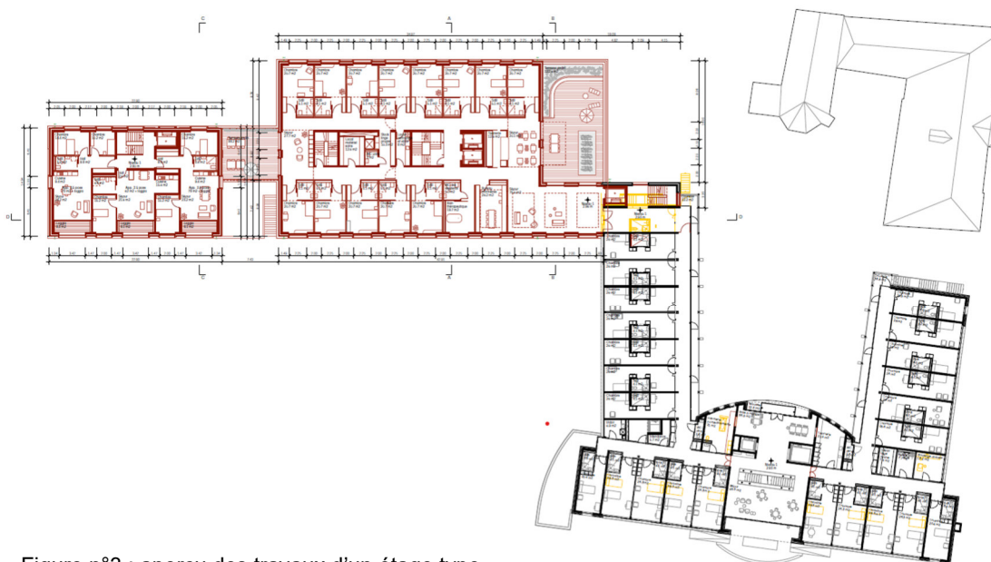
Figure n°3 : aperçu des travaux d'un étage type

La structure porteuse est en béton armé, afin de répondre aux exigences budgétaires, statiques et de sécurité. Les revêtements de façades sont prévus en éléments de plaquage en béton préfabriqué au niveau du socle et la toiture est plate.