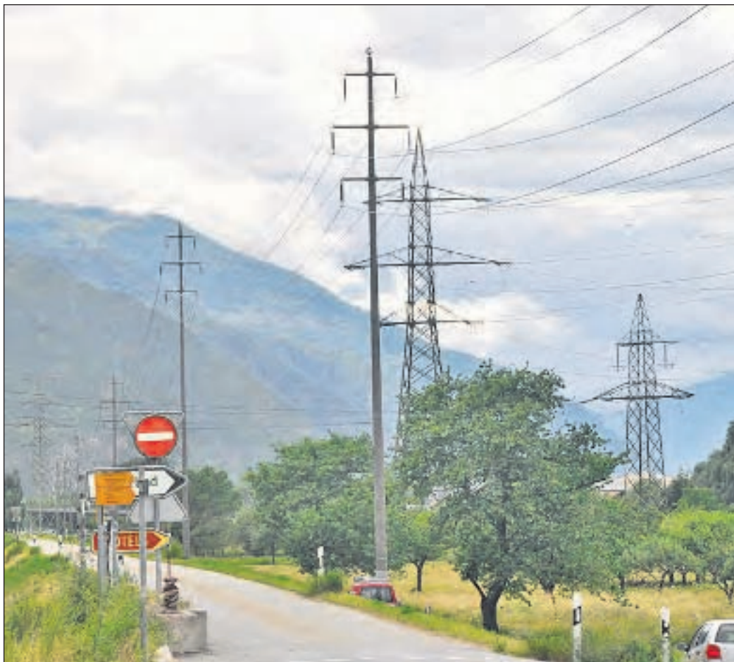
Das Parlament trat gestern auf eine Erdverlegung der 65-kV-Leitung zwischen Brig und Visp ein.

Die Arbeiten für die prioritären Massnahmen (PM) im Raum Visp laufen seit Januar 2009. In diesem Jahr wird nun der Abflussquerschnitt verbreitert und mit dem daraus anfallenden Material der neue Rhonedamm in Baltschieder gebaut. Damit die für die Sicherung des prioritären Abschnitts notwendigen Verbreiterungen der Rhone zwischen der Mündung der Gamsa und den Lonzawerken vorgenommen werden können, muss die 65-kV-Hochspannungsleitung, welche derzeit direkt am nördlichen Dammfuss der Rhone liegt, verlegt werden. Ursprünglich war geplant, dies mittels Freileitung am Nordhang zu bewerkstelligen. Dafür waren Kosten von vier Millionen Franken geplant. Angesichts zahlreicher Einsprachen hat sich der Staatsrat für eine Erdverlegung auf einer Länge von etwa fünf Kilometern ausgesprochen. Die Umsetzung dieser Arbeiten ist ab dem Herbst 2010 geplant. Zurzeit erfolgen die Einigungsgespräche mit dem BAFU bezüglich der Wahl des Kabelquerschnittes und der daraus resultierenden finanziellen Beteiligung des Bundes. Im Verpflichtungskredit, welcher vom Grossen Rat am 8. Februar 2007 genehmigt worden ist, waren insgesamt 7,3 Millionen Franken für Werkleitungsverlegungen geplant. Die zusätzlichen Kosten für diese Erdverlegung werden auf 13,6 Millionen Franken geschätzt. Die verbleibenden Kosten zu lasten des Kantons betragen, angesichts der erwarteten Beiträge von Gemeinden und Dritten, 16 Prozent von 13,6 Millionen Franken, also 2,1 Millionen Franken.