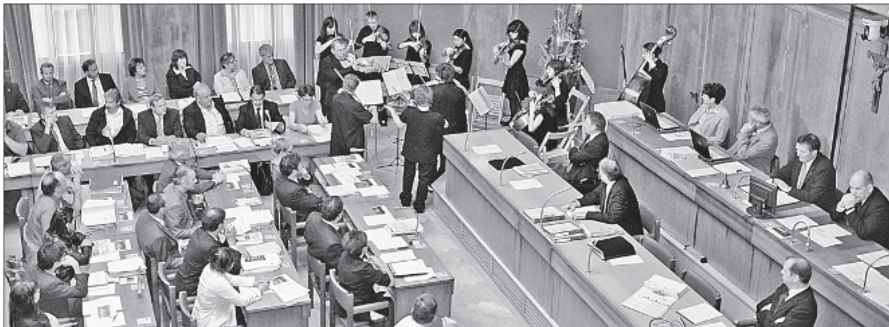
Zu Beginn der Juni-Session gabs Musik, danach folgten Zahlen und Berichte...

Walliser Parlament befasst sich mit der Jahresrechnung, den Berichten der Regierung und des Finanzinspektorats