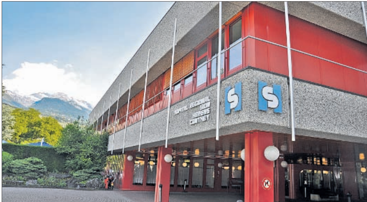
Im Spital Sitten hat das Gesundheitsnetz Wallis gestern mit Vehemenz auf die in den Medien kursierende Kritik reagiert.