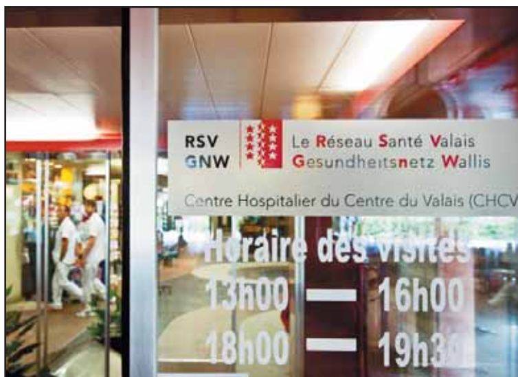
Le RSV se veut transparent. Il appelle de ses vœux un audit. HOFMANN

Cet inconvénient du système multisite est appelé à être cor-