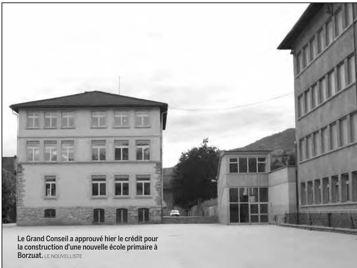
Le Grand Conseil a approuvé hier le crédit pour la construction d'une nouvelle école primaire à Borzuat. LE NOUVELLISTE

Cet ensemble architectural sera complété par une nouvelle construction, prévue sur deux étages. Elle prendra place directement à côté de la salle de gymnastique actuelle. D'ailleurs, le nouveau bâtiment dis-