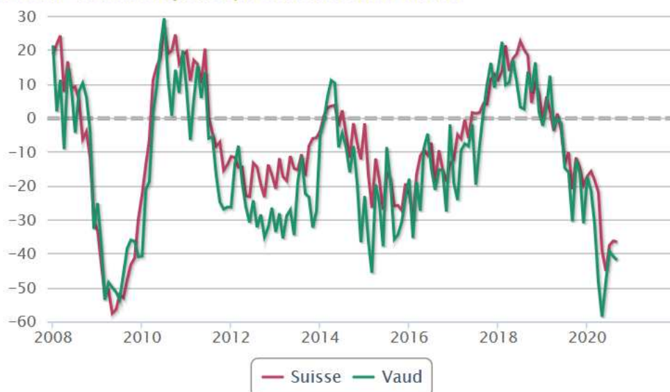
Industrie - Indicateur synthétique de la marche des affaires

(Extrait de Conjoncture vaudoise, 17.08.2020)