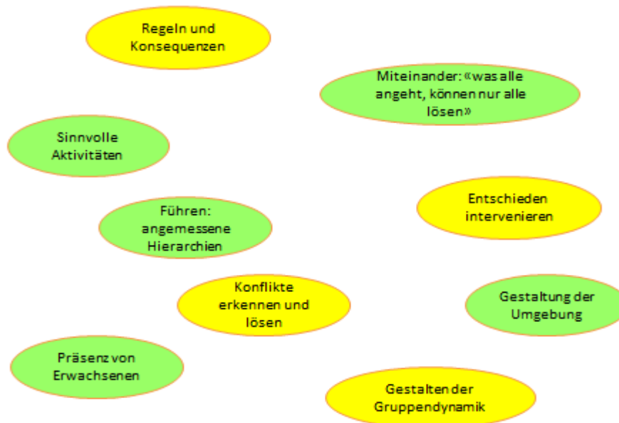
Abbildung 3 Wie kann Gewalt an der Schule gehemmt werden?