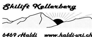
Skihaus SSC Schattdorf, Haldi