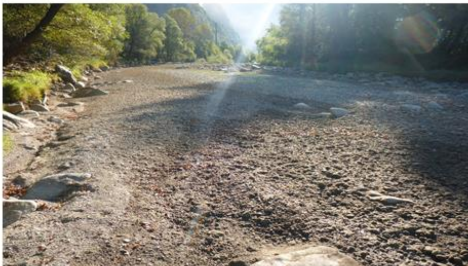
Fiume Ticino – Tratto Bodio-Personico (ottobre 2016)