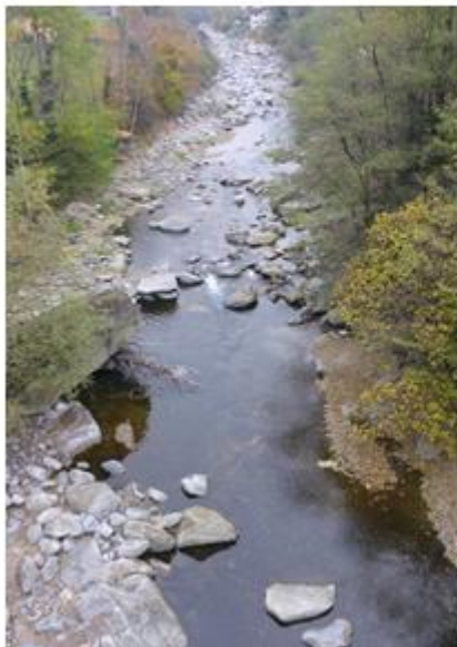
L'attuale deflusso minimo del fiume Ticino (Giornico)