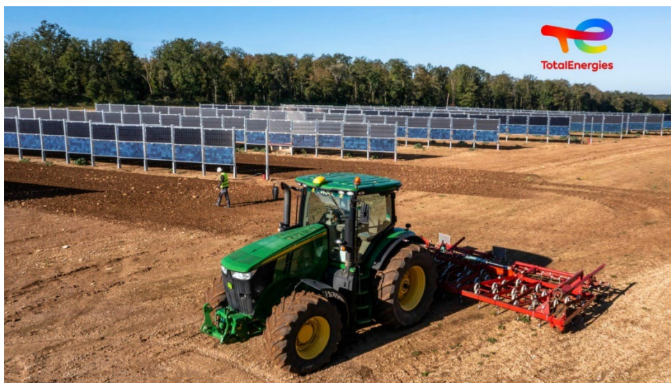
Pannelli bifacciali verticali a Channey (Francia)

Le foto in seguito mostrano bene come i pannelli in questione possano convivere con la natura e le attività agricole