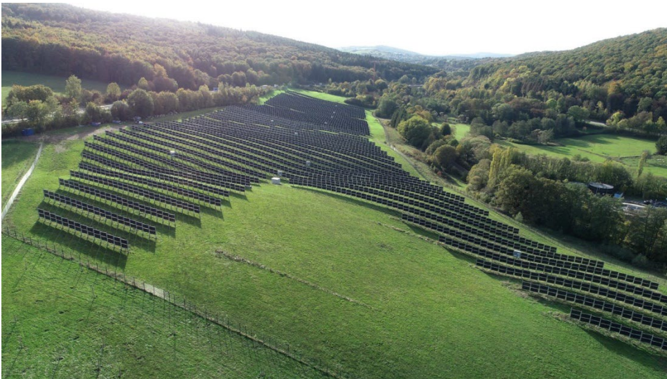
Pannelli bifacciali verticali a Channey (Francia)