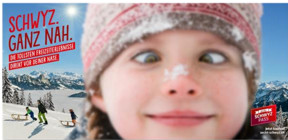
Abb. 3: Werbeplakat der Tourismuskampagne

Beworben wurden die Inhalte der Tourismuskampagne «Schwyz. Ganz nah.» in mehreren Wellen – unter anderem in Kooperation mit den vier Tourismusregionen, welche ihre eigenen Kanäle (wie Newsletter, Social-Media) zur Verfügung stellten, sowie mit Luzern Tourismus (Nutzung von Synergien bei der Kommunikation) und Zürich Tourismus (gemeinsame Herbstkampagne 2020). Umgesetzt wurden unter anderem folgende Massnahmen: Aussenwerbung über Flyer und Plakate (z. B. an Verkaufsstellen der Tourismusregionen, an Bahnhöfen und in öffentlichen Verkehrsmitteln), Inserate in Online- und Print-Medien (z. B. Bote der Urschweiz, 20 Minuten, Tage-Anzeiger, Schweizer Familie, Schweiz am Sonntag, Le Temps), über eine Radiokampagne mit Spots zum «Ächt Schwyz»-Pass (Radio Central, Argovia, Zürisee, Radio24) sowie eine Social-Media-Kampagne – beispielsweise mit Banner und Videos zum «Ächt Schwyz»-Pass (via Facebook, Instagram, Google-Werbung, Youtube, Mobiltelefone). Auch wurden verschiedene Wettbewerbe und Verlosungen via Radio, Print- und Online-Kanäle lanciert. Im Herbst 2020 wurden zudem Schwyzer Hotelangebote im Rahmen einer Kuoni/Railtour-Kampagne auf diversen Kanälen beworben (Angebot von Buchungspackages in Hotels über Newsletter und Webseite von Kuoni).