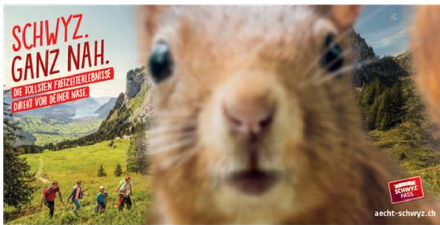
Abb. 4: Poster-of-the-Month vom November 2020, ausgezeichnet durch APG/SGA.

Das Sujet der Tourismus-Kampagne «Schwyz. Ganz nah.» fand Anklang bei der Bevölkerung und Experten/-innen. Auf Youtube wurde das Video bis heute über 90 000 Mal angeschaut. Die für die Kampagne gestalteten Plakate wiesen eine hohe Qualität auf. Dies zeigt die Ernennung des «Schwyz. Ganz nah.»-Posters zum Poster-of-the-Month im November 2020 durch die APGISGA.