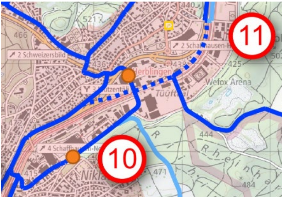
Abb. 3: Angepasste Änderung Nr. 10 TRP Radrouten aufgrund des Wegfalls des Nationalstrassenausbaus

Die folgende Abbildung zeigt die angepasste Veloführung im Herblingertal.