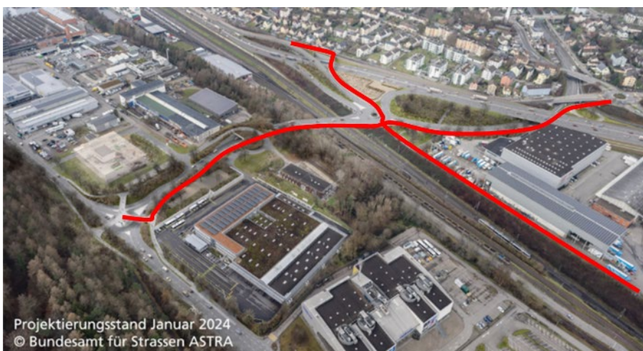
Abb. 2: Visualisierung Anschluss Mutzentäli mit den geplanten Veloverbindungen