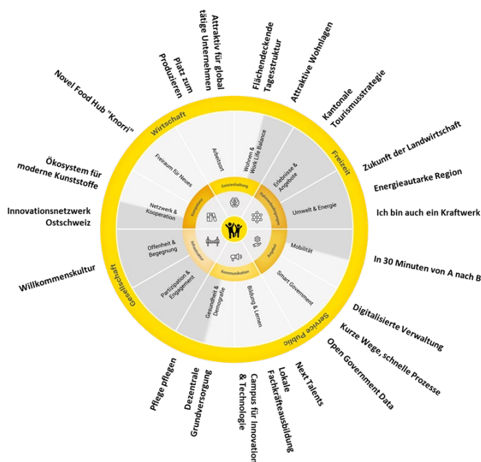
Abbildung 2: Die Fokusprojekte des Regierungsrates im Handlungskompass der Schaffhauser Lebensqualität

Die über 60 Projekte der Entwicklungsstrategie müssen aus Sicht des Regierungsrats schrittweise umgesetzt werden. Für zahlreiche Projekte sind bereits Massnahmen in Umsetzung. Weiter ist auch die Finanzierung der Projekte und Massnahmen nicht umfassend sichergestellt. Nicht alle Projekte fallen in die Zuständigkeit des Kantons und der kantonalen Verwaltung. Wirtschaft, Politik und Gesellschaft sind gleichermaßen gefordert, die Entwicklungsstrategie als Ideenquelle und Legitimationsgrundlage zu nutzen und die Umsetzung der ihnen wichtigen Projekte selbst voranzutreiben. Vor diesem Hintergrund hat der Regierungsrat die Projekte mit den eigenen Zielsetzungen, beispielsweise aus der Legislaturplanung, abgeglichen, priorisiert und 21 kantonale Fokusprojekte identifiziert. Diese 21 Projekte decken aus Sicht der Regierung zudem eine grosse Bandbreite des wirtschaftlichen und gesellschaftlichen Lebens im Kanton Schaffhausen ab.