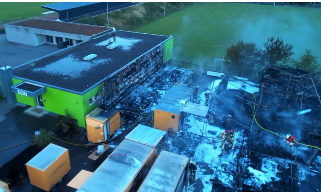
Bild eines Schadenereignisses im Jahr 2022 (Durch eine Gasexplosion verursachter Brand in Neuhausen am Rheinfl)