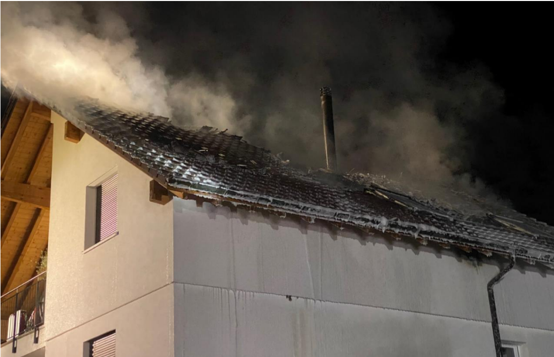
Bild eines Schadenereignisses im Jahr 2022 (Brand eines Einfamilienhauses in Wilchingen)