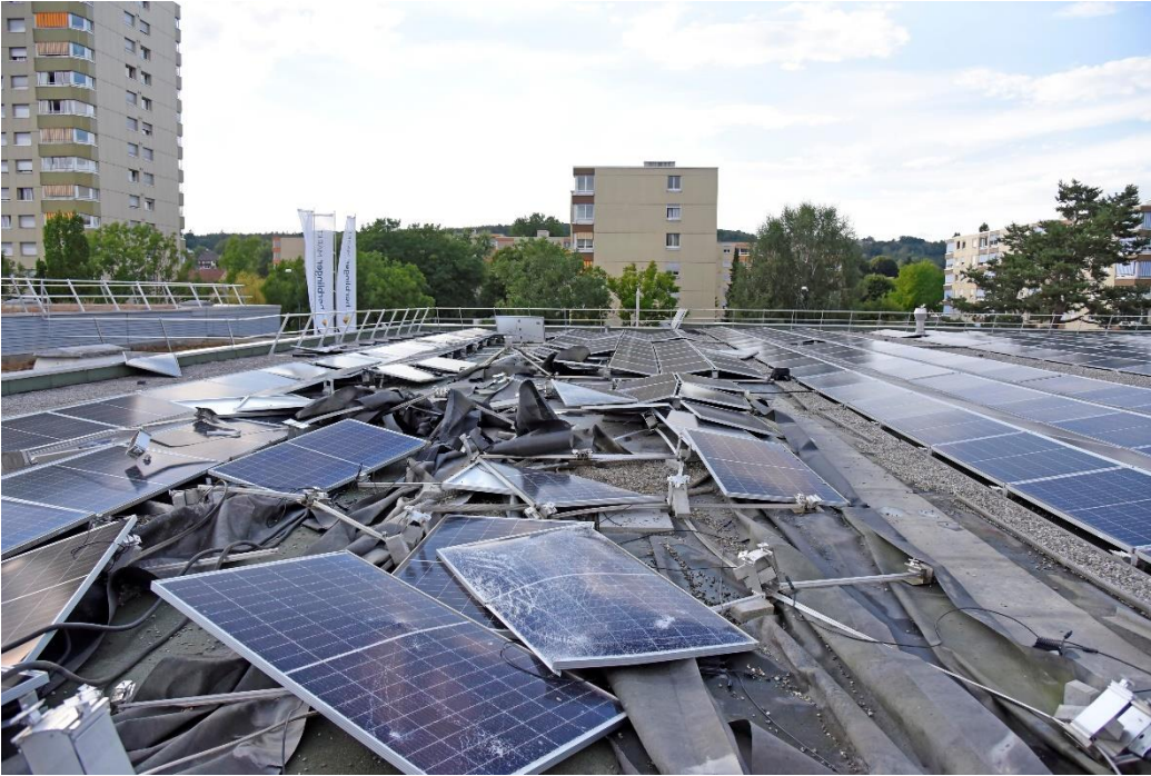
Bild eines Schadenereignisses im Jahr 2022 (Windhose vom 30.7.2022 in Schaffhausen)

im Ausmass von rund CHF 5,195 Mio. eingetreten waren. Dadurch wurde der 10-Jahresdurchschnitt der Elementarschäden, welcher Ende 2021 CHF 1'702'575 betrug, deutlich unterschritten.