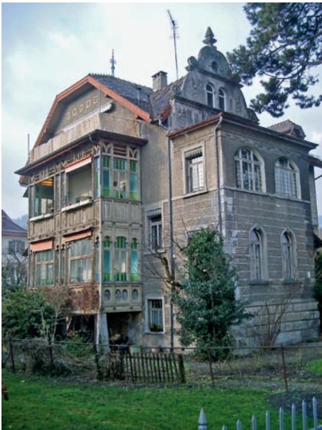
Villa Esther, St. Margrethen