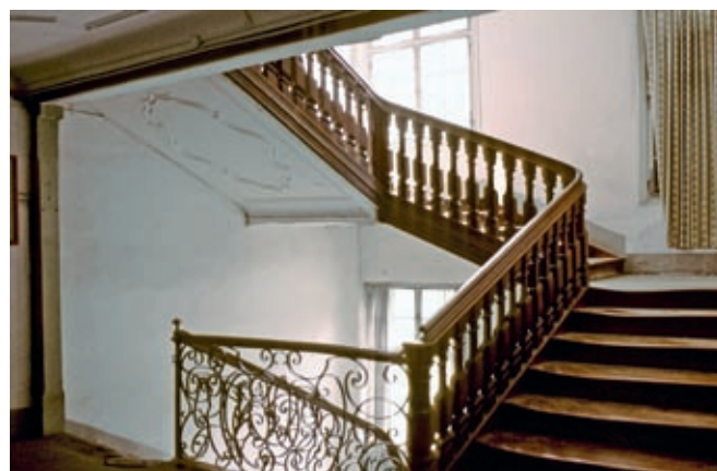
Treppe im Innern des Barockhauses Hirschen