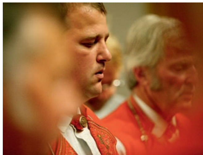
Naturjodel während einer Informationsveranstaltung zum Klanghaus Toggenburg