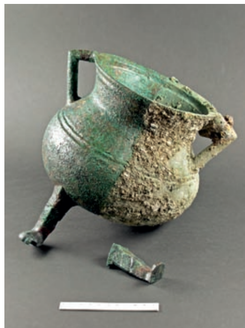
Bronzener Dreibeintopf (Kochtopf) aus Weesen, zur Hälfte restauriert, Höhe 22 cm

Im Hinblick auf kommende, nicht vorhersehbare Projekte sowie aufgrund der Erfahrungen mit dem 2006 gesprochenen Kredit wird mit Regierungsbeschluss vom 12. Februar 2008 (RRB 2008/94) eine Wiederöffnung sowie eine Erhöhung auf Fr. 300'000.– als sinnvoll erachtet. Der Kanton St.Gallen stellt der Kantonsarchäologie einen Rahmenkredit von Fr. 300'000.– für nicht planbare, nicht absehbare und nicht verschiebbare archäologische Grabungen im Zusammenhang mit Bauvorhaben Dritter zur Verfügung.