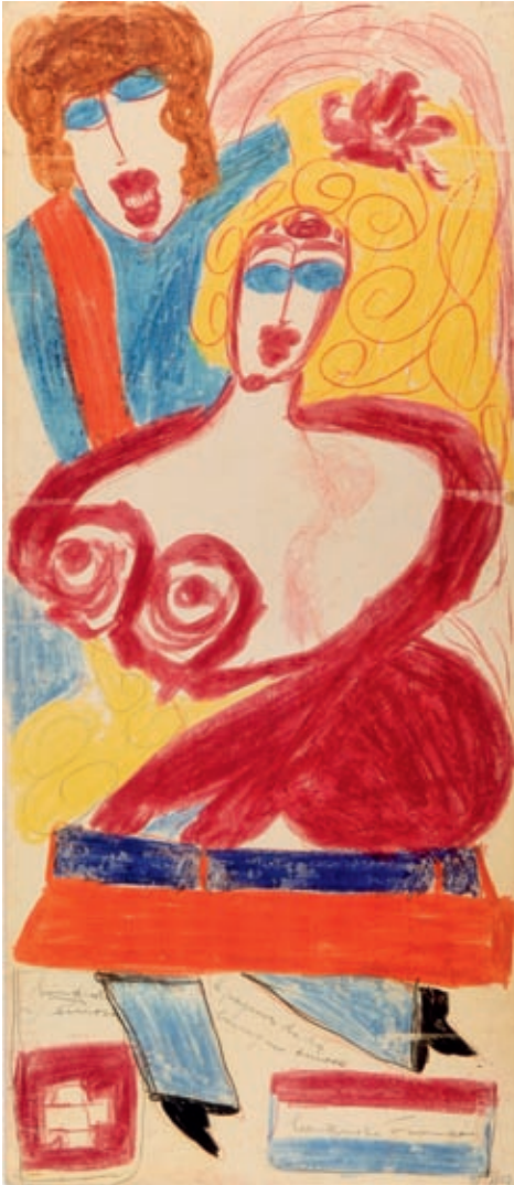
Museum im Lagerhaus: Aloyse, Le payeur de la banque Suisse, 1948