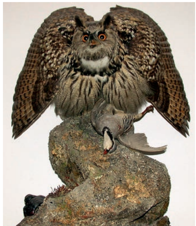
Uhu auf Jagd

Das Naturmuseum St.Gallen plant in Zusammenarbeit mit dem Naturmuseum Olten und der Schweizerischen Vogelwarte eine Sonderausstellung mit dem Arbeitstitel «Krummer Schnabel, scharfe Krallen – unsere Tag- und Nachtgreifvögel». Darin werden sich Besucherinnen und Besucher der Welt der heimischen Greifvögel, Eulen und Käuze auf ungewohnte Art und Weise nähern können. Die Tiere spielen im ganzen Naturgefüge aufgrund ihrer regulierenden Wirkung eine zentrale Rolle und sind kulturgeschichtlich von Bedeutung. Die Ausstellung ist als Wanderausstellung konzipiert und wird nach der Eröffnung im Herbst 2009 in Olten ab Frühling 2010 im Naturmuseum St.Gallen zu sehen sein. Sie wird von einem Rahmenprogramm begleitet und weitere Stationen in anderen Naturmuseen der Schweiz sind bereits vorgesehen. Die Gesamtkosten von rund 180'000 Franken finanziert das Naturmuseum St.Gallen mit Fr. 30'000.–, das Naturmuseum Olten und die Vogelwarte mit je Fr. 40'000.–. Der Kanton St.Gallen