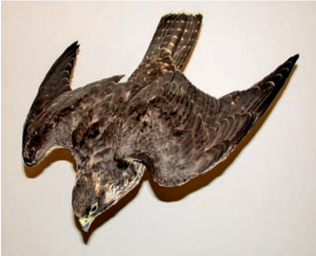
Falke beim Angriffsflug