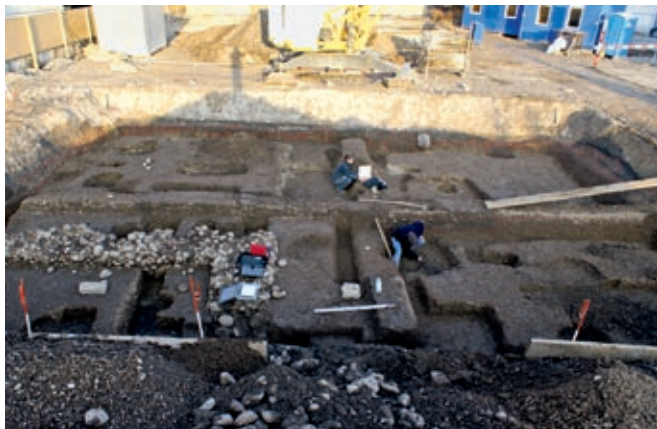
Rapperswil-Jona, Kempraten, Grabung Parz. 1076: Übersicht über die westliche Baugrube beim Grabungsabschluss: Die archäologischen Ausgrabungen brachten eine Fundamentecke eines römischen Gebäudes zum Vorschein (links unten)