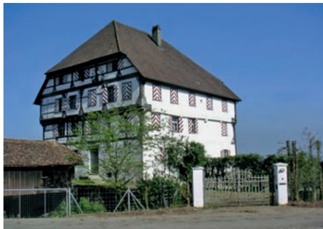
Schloss Zuckenriet, Niederhelfenschwil