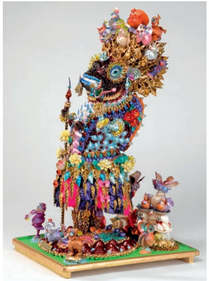
Lausanne: Paul Amar, La femme animale, 2002

Der diesjährige Gastkanton an der Olma, der Kanton Waadt, präsentiert in St.Gallen auch ein reichhaltiges kulturelles Programm. Ein kultureller Höhepunkt des Kantons ist die berühmte, von Jean Dubuffet begründete Collection de l'Art Brut in Lausanne, die mit ihrer Ausrichtung auf internationale Art Brut und Outsider Art gern als «grosse Schwester» des Museums im Lagerhaus St.Gallen bezeichnet wird. Dieses legt seinen Schwerpunkt auf schweizerische Naive Kunst und Art Brut/Outsider Art. Beide Häuser gelten als einzigartig in der Schweiz und bestimmen massgeblich den Schweizer Auftritt in der internationalen Kunstszene der Outsider Art. Eine einmalige Ausstellungskooperation im Museum im Lagerhaus mit dem Kanton Waadt zur Olma 2008 vom 1. September bis 2. November ist eine grosse Chance, die Gemeinsamkeiten und Unterschiede sowie die Position und Bedeutung des Museums im Lagerhaus einer breiten Öffentlichkeit zu vermitteln. Um das Kooperationsprojekt zu realisieren, fallen zwei spezielle Projekte für das Museum im Lagerhaus an. Beide sind mit Extrakosten verbunden, weshalb sich der Kanton an beiden beteiligt und so die Bedeutung des Museums im Lagerhaus wie auch eines interkantonalen Kulturaustauschs hervorhebt.