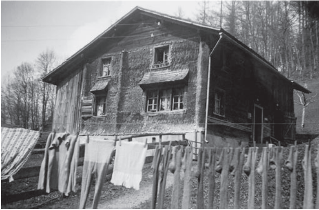
Bauernhaus Mels um 1950