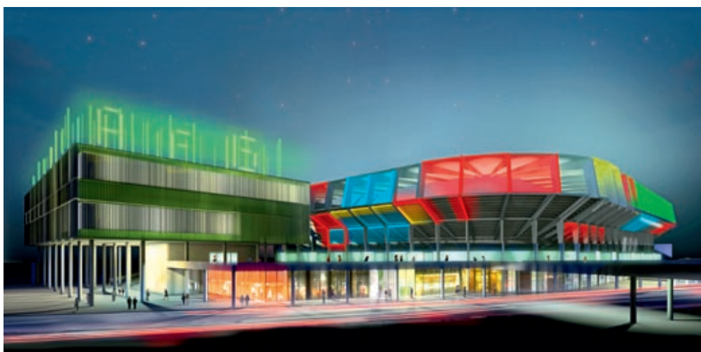
Modell Aussenansicht der AFG Arena mit Kunst am Bau von Keith Sonnier

Für die Realisation des Kunst-am-Bau-Projekts wird mit Kosten von rund 2 Mio. Franken gerechnet. Sie setzen sich aus den Herstellungskosten (Projektierung, Lieferung und Montage) von rund 1,1 Mio. Franken und Honorarkosten von rund 900'000 Franken zusammen. Der Finanzierungsplan sieht eine Finanzierung mittels Eigenleistungen, Sponsorengeldern, Beiträgen von Stiftungen, einem Standortbeitrag der Stadt St.Gallen und Geldern aus dem Lotteriefonds vor. Der Kanton St.Gallen unterstützt das Projekt mit einem Beitrag von Fr.650'000.–. Das Engagement des Kantons ist verknüpft mit der Erwartung, dass die AFG Arena St.Gallen das Projekt in mindestens gleicher Höhe mitfinanziert.