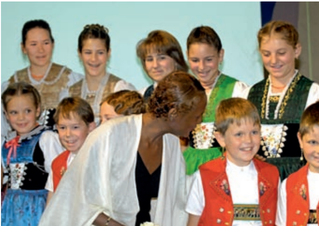
Auftritt am Internationalen Kongress für die zweite Lebenshälfte 2005

World Ageing & Generations Congress in St.Gallen 2008 bis 2010 Fr. 300'000.–