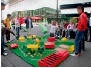
Kinder bauen ihre Stadt