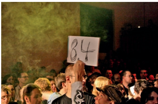
Poetry Slam in der Grabenhalle

Einmal im Jahr kommt die deutschsprachige Performance Poetry Szene zusammen, um an den deutschsprachigen Poetry Slam Meisterschaften den virtuosesten Bühnendichter, die virtuoseste Bühnendichterin, zu küren. Nach den Austragungsorten München und Berlin in den letzten Jahren reisen im November 2008 rund 250 Performance Poeten und Poetinnen nach Zürich und stellen sich dem Schweizer Publikum. Integriert ist auch der Jugendwettbewerb u20 Poetry Slam, der die Schweizer Jugend aufruft und motiviert, selbst Texte zu schreiben und aufzutreten. Der Kanton St.Gallen ist einer der Pionierkantone im Bereich Poetry Slam. In der Organisation des kulturellen Grossanlasses sind daher auch einige St.Galler Fachpersonen vertreten und auch auf der Bühne zu sehen. Am Gesamtaufwand von rund 280'000 Franken beteiligt sich der Kanton St.Gallen mit einem Beitrag von Fr. 12'000.–. Weitere Beiträge werden durch Sponsoring, Eigenleistungen, Stiftungen und weitere Kantone erwirtschaftet.