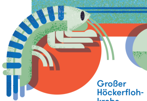
Großer Höckerfloh- krebs