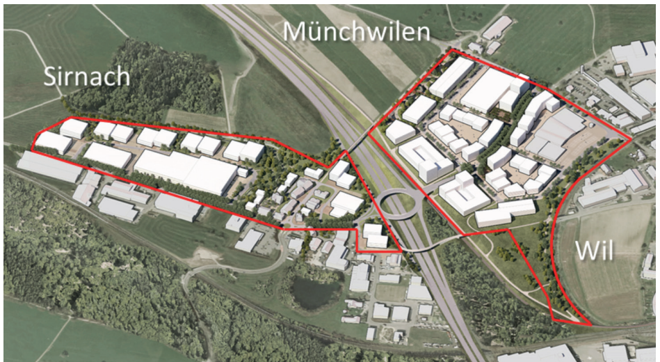
Areal Wil West mit den Teilgebieten Münchwilen und Sirnach

Mit der Einzonung und der Arealentwicklung Wil West soll die wirtschaftliche Eigenständigkeit der Region als Arbeitsplatzstandort gewahrt und weiter gestärkt werden. Verbunden mit der Erschliessung des Wirtschaftsgebiets soll zusätzlich die dringend erforderliche verkehrliche Entlastung des Stadtkerns Wil und der umliegenden Gemeinden vorangetrieben werden. Die wesentlichen verkehrlichen Massnahmen für diese angestrebte Entwicklung in Wil West sind die Realisierung des neuen Autobahnanschlusses Wil West, die Arealerschliessung über die Dreibrunnenallee (Kantonsstrasse Thurgau), die Netzergänzung Nord als Umfahrungsstrasse von Wil (Kantonsstrasse St.Gallen), die Verlegung der Frauenfeld-Wil-Bahn mit neuer Haltestelle, die neue Turbo-Haltestelle (Bahnlinie Wil-Weinfelden), die Einbindung in das öv- und Langsamverkehrsnetz (Fuss- und Velowege) sowie die flankierenden Massnahmen der Stadt und Region Wil. Für diese Vorhaben sind separate Beschlussfassungen im Rahmen der jeweiligen Zuständigkeiten auf den Ebenen Bund, Kantone Thurgau und St.Gallen sowie auf kommunaler Ebene erforderlich. Die verkehrlichen Massnahmen sind deshalb nicht Gegenstand dieser Vorlage.