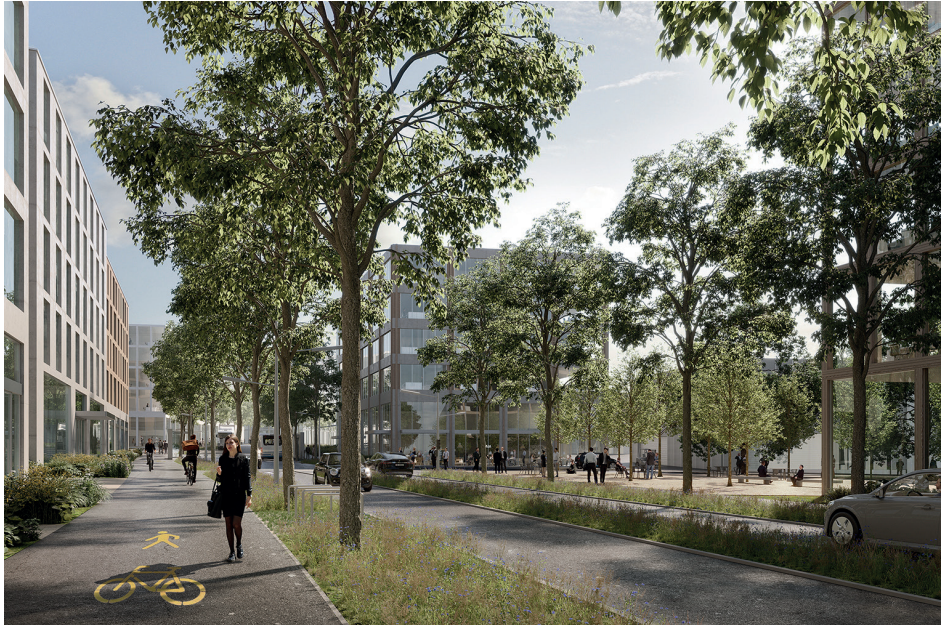
Visualisierung Dreibrunnentallee in Wil West (Areal Münchwilen)

Nicht im Fokus stehen Investorinnen und Investoren, die Liegenschaften als Renditeobjekte halten. Zum aktuellen Zeitpunkt ist noch offen, in welchen Etappen das Areal bzw. die einzelnen Grundstücke und Baufelder veräussert und genutzt werden. Um auf die Marktverhältnisse und die Bedürfnisse am Markt zielgerichtet eingehen zu können, wird ein gewisser Spielraum benötigt. Der zeitliche Entwicklungs- und Absatzhorizont im Projekt Wil West umfasst aus Sicht des Kantons St.Gallen einen Zeitraum von 20 bis 30 Jahren.