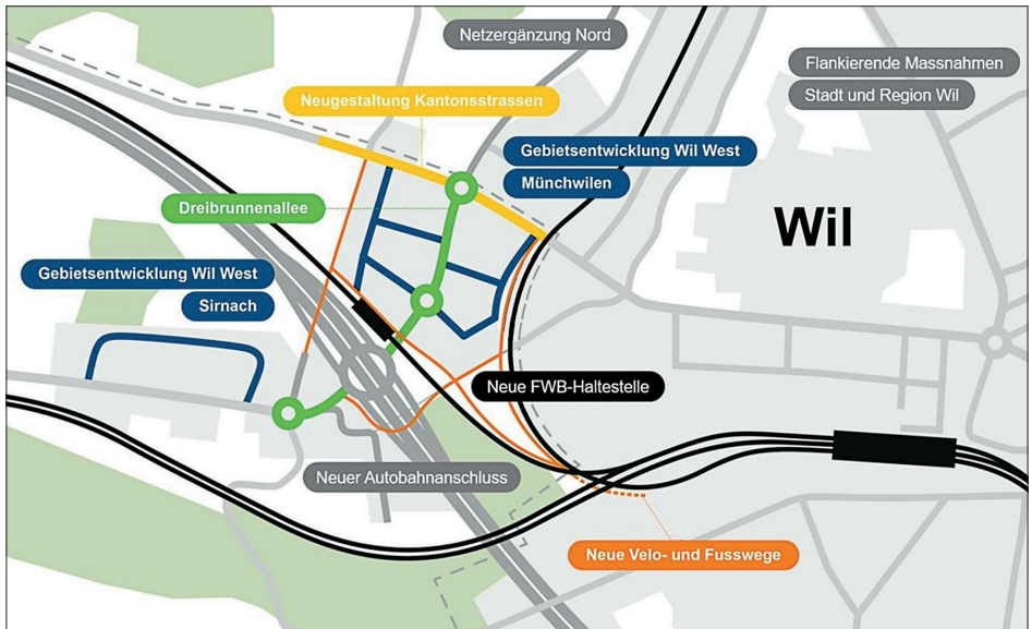
Übersicht Gesamtvorhaben WILWEST