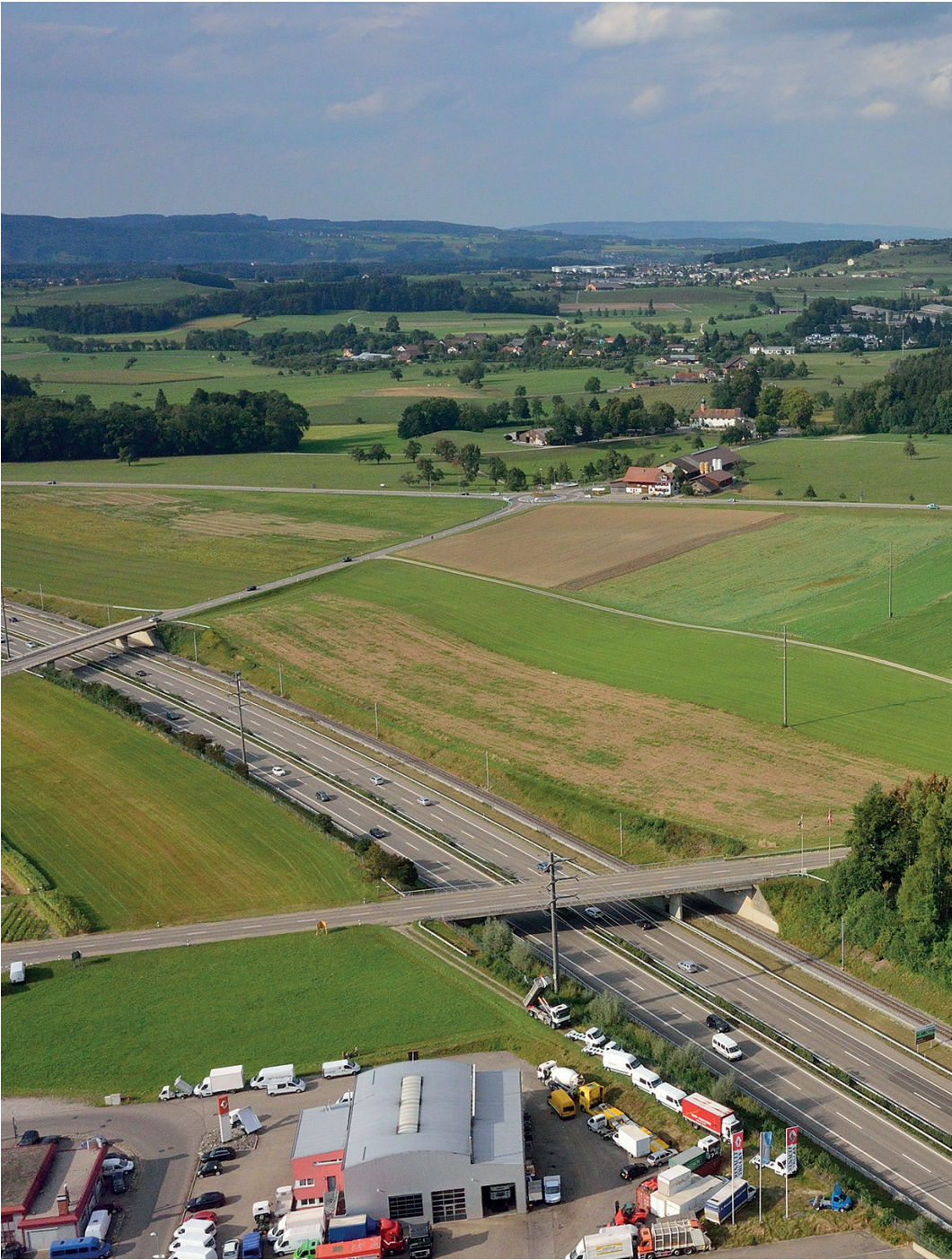
Luftbild Wil West (Areal Münchwilen)