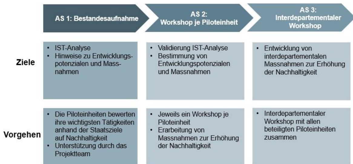
Abbildung 2: Die Arbeitsschritte (AS) im Überblick