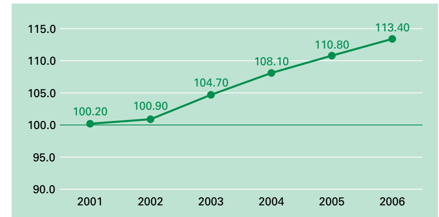
Abb. 1: Index der Steuerbelastung für den Kanton St.Gallen [100 = CH-Mittel] (Gesamtindex für Einkommens- und Vermögenssteuern, Gewinn- und Kapitalsteuern, Motorfahrzeugsteuern).

Der dringlichste Änderungsbedarf ergibt sich aus dem im interkantonalen Vergleich ungünstigen Belastungsniveau sowohl bei den natürlichen als auch bei den juristischen Personen. Die nachfolgende Grafik zeigt die Entwicklung der Steuerbelastung im Kanton St.Gallen im Vergleich zum schweizerischen Durchschnitt auf: