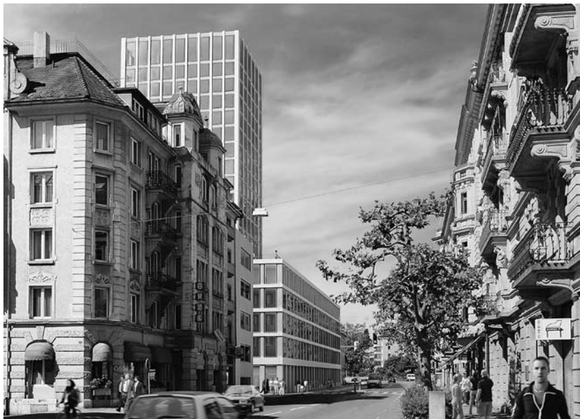
(Fotomontage) Ansicht von der Rosenbergstrasse

Die tragenden Bauteile werden als Massivbau erstellt. Fassadenstützen, Tragwände und Treppenhäuser sind in Stahlbeton, die übrigen Innenwände in Leichtbauweise ausgeführt. Die gewählte Bauweise bietet grosse Flexibilität in der Raumeinteilung und ermöglicht jederzeit Anpassungen an neue Bedürfnisse. Die Fassade besteht aus raumhohen Verbundfenstern und vorgefertigten Betonelementen, die sich in ihrer Farbgebung an den Sandstein vieler umliegender Gebäude anlehnen.