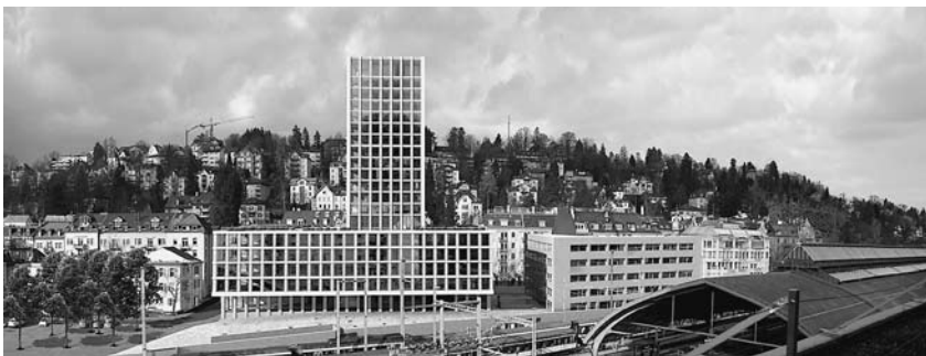
(Fotomontage) Gesamtübersicht des Fachhochschulzentrums von Süden her gesehen

Der Neubau für das Fachhochschulzentrum wird im Gebiet nordwestlich des Hauptbahnhofs St.Gallen zwischen den Bahnanlagen, dem Quartier St.Leonhard und der Rosenbergstrasse entstehen. Dies ist ein zentrales innerstädtisches Entwicklungsgebiet. Die zentrale Lage direkt neben dem Hauptbahnhof mit optimaler Anbindung an den öffentlichen Verkehr macht die FHS St.Gallen besonders attraktiv.