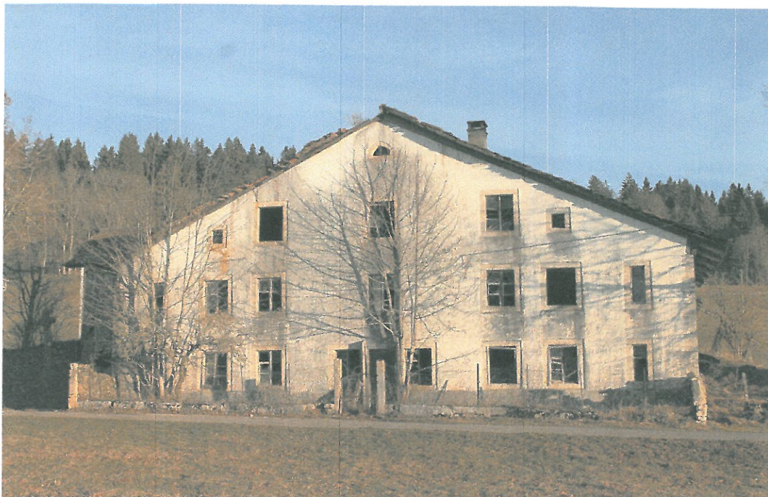
Vue de la façade sud