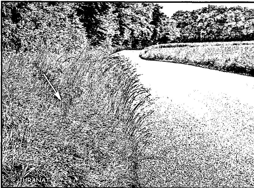
Photo n° 1. Orchis bouc, Himantoglossum hircinum , poussant sur un talus.

Chaque année, à partir de mi-mai, le Service des ponts et chaussées, ainsi que les cantonniers ou mandataires communaux, commencent à faucher les bords des routes cantonales et communales. Cette démarche permet d'assurer aux conducteurs la parfaite visibilité de la chaussée et prévient les risques d'accidents, tout en garantissant, par un entretien régulier, la propreté et le maintien en état des bords de routes. Or, certains de ces derniers sont devenus les ultimes refuges de différents organismes vivants, animaux et végétaux, qui ne trouvent plus, dans les zones utilisées intensivement par l'agriculture, les milieux dont ils ont besoin. Nous pensons notamment aux Orchidées rares (Photos 1 et 2) et aux plantes hôtes de nombreux papillons qui égailent nos campagnes de leurs splendides couleurs (Photos 3 et 4).