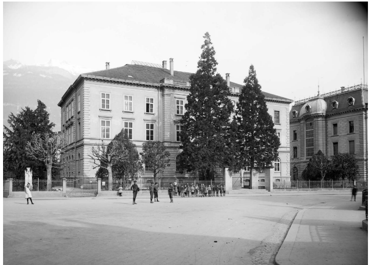
Abbildung 1: Historische Aussenansicht (Foto Salzborn, 1911; Stadtarchiv Chur)

Durch frühere Umbauten büsste das Gebäude wertvolle Originalsubstanz ein. Der Einbau von Wänden veränderte den Charakter des Gebäudes stark. Ebenso die massive Zwischendecke, die in den ursprünglichen Grossratssaal eingezogen wurde und diesen in zwei Geschosse unterteilt. Wird das Staatsgebäude als Gerichtssitz genutzt, können weite Teile des geschichtsträchtigen Baus wieder ihrem ursprünglichen Zweck zugeführt werden. Gleichzeitig sollen die Haustechnik modernisiert, die Baustatik verbessert sowie verschiedene Gebäudeteile energetisch optimiert werden.