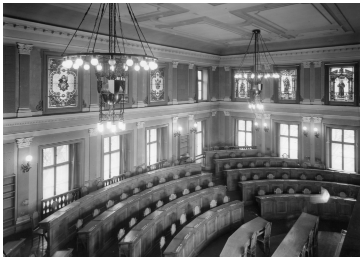
Abbildung 3: Historische Innenansicht Grossratsaal (Sig. F 9/46, ca. 1915)

Die Ausarbeitung des Bauprojekts wurde «Aebi & Vincent Architekten AG» aus Bern zusammen mit «Fanzun AG Architekten Ingenieure Berater» aus Chur übertragen. Dieses Siegerteam wurde in einem öffentlichen Planerwahlverfahren ermittelt. Es weist eine sehr grosse Erfahrung im Umgang mit historischen Bauten auf.