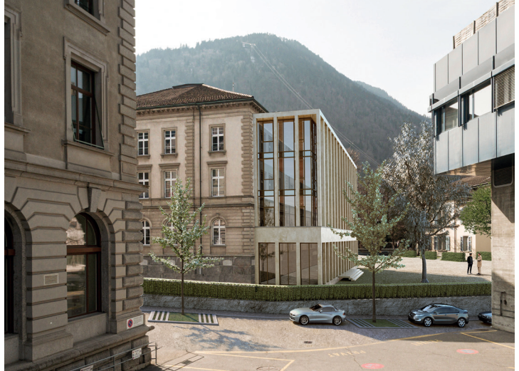
Abbildung 2: Visualisierung Erweiterungsanbau

auch die erwarteten Auswirkungen des Digitalisierungsprojekts «Justizia 4.0», das voraussichtlich um das Jahr 2030 gesamtschweizerisch umgesetzt wird.