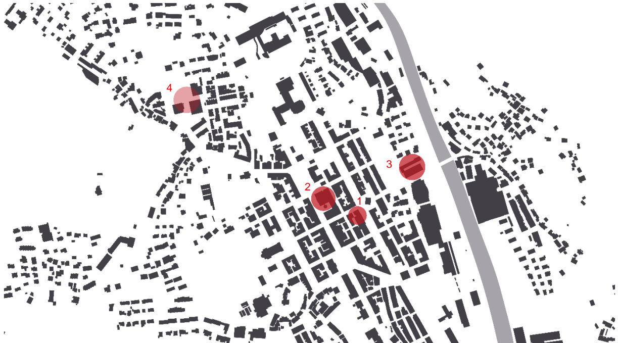
Abbildung 3. Entwicklungsschwerpunkte Glarus