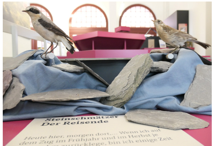
Saisonale Wechselobjekte: Wechselobjekte zu aktuellen Themen machen die Ausstellung auch für wiederkehrende Gäste attraktiv und schaffen einen aktuellen Bezug zum Welterbe-Gebiet.