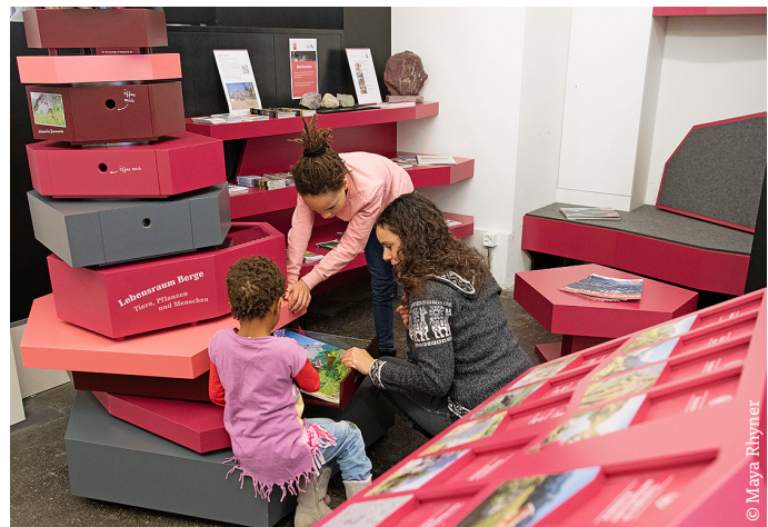
Interaktiver Turm: Speziell Familien nutzen die Spiele, die über Landschaft, Lebensräume und Arten im Gebirge informieren. Wegen regem Gebrauch leidet der Drehturm unter ersten Abnützungen.