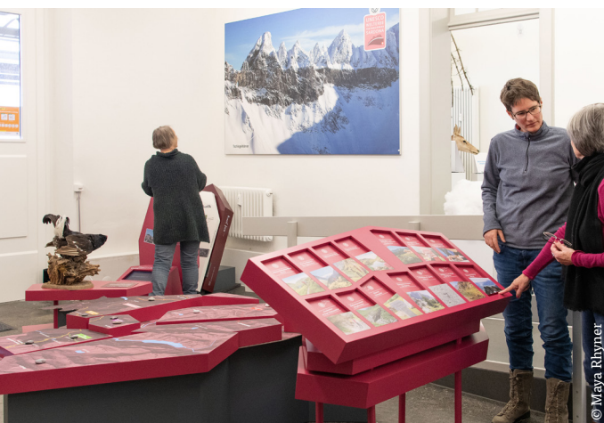
3D-Karte mit Ausflugstipps: Eine 3D-Karte mit Ausflugstipps zeigt Erlebnismöglichkeiten in allen Glarner Gemeinden auf. Das Naturzentrum-Team berät Gäste und informiert über das Welterbe.