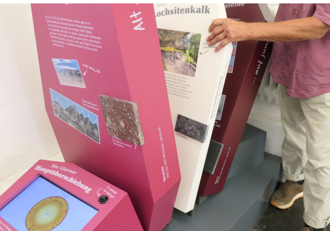
Videostation mit Kipptafeln: Ein Bildschirm und Kipptafeln informieren über die Gebirgsbildung. Um die Tonqualität der Videostation zu optimieren, soll sie mit Handhörern ausgerüstet werden.