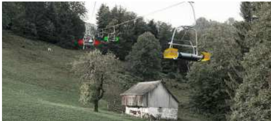
Modulares-Kistensystem zur Bestückung der Sesselbahn (Freizeit, Denkzeit) in Filzbach