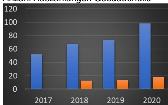
Anzahl Auszahlungen Gebäudehülle

M-01: Wärmedämmung Fassade, Dach, Wand und Boden gegen Erdreich