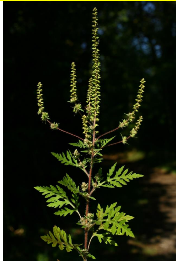
Ambrosia artemisiifolia