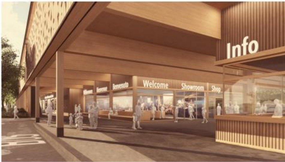
Abb. Eingangsbereich mit Showroom

Mit der Gestaltung des neuen Eingangs entstehen auch neue, vielfältige Freiräume. Um den gegenwärtigen und zukünftigen Ansprüchen der Museumsbesuchenden gerecht zu werden, ist eine gute Verteilung der Freiraumfunktionen massgebend. Die Museumsstrasse führt künftig direkt an den neuen Empfangs- und Ankunftsplatz. Der Grünstreifen mit Säulenbäumen längs vor dem Neubau bildet einen Grünfilter und sorgt für eine adäquate Trennung zwischen Strassenraum und Erschliessungsbereich Besucher.