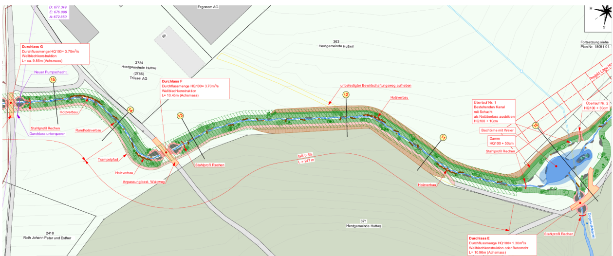
Abbildung 3: Ausschnitt aus dem geplanten Gewässerlauf

Deshalb soll der Weierbach grossräumig umgelegt und auf einer Länge von rund 1,2 km offen, hochwassersicher und bezüglich Böschungsgestaltung, Neigung und Wassertiefe so gestaltet werden, dass die Biodiversität am Bachverlauf gefördert wird. Zudem wird eine Weiheranlage erstellt, die im Überlastfall als kleines Rückhaltebecken dient.