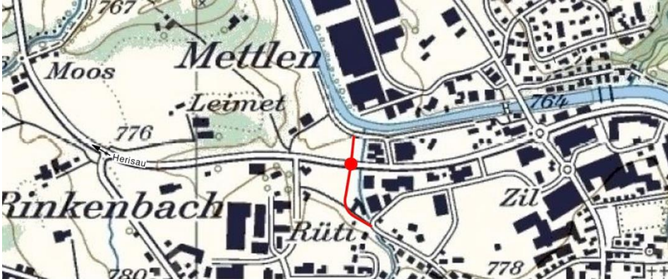
Abb. 1 Standort Neubau Verkehrskreisel Schmitzenbach