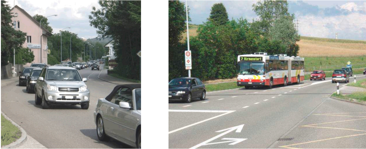
Abbildung 2: Überlastete Badenerstrasse K 272 im Bereich Knoten K 272/K 418

Die K 272 und K 418 sind als Versorgungsrouten für Ausnahmetransporte Typ I respektive Typ II freizuhalten. Im Weiteren sind sie Bestandteil des Netzes der kantonalen Radrouten (R722/R723) und der Velo-Mittellandroute 5. Der Radweg entlang der Badenerstrasse ist auch als Schulweg stark frequentiert. Auf der K 272 und der K 418 verkehren verschiedene Buslinien, welche rasche Verbindungen nach Baden, Brugg und zur neuen Haltestelle Mellingen Heitersberg ermöglichen.