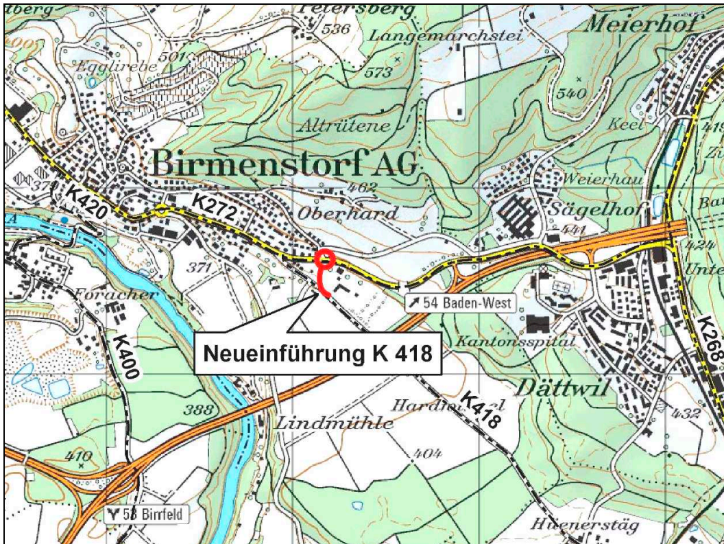
Abbildung 1: Übersicht Kantonsstrassen Birmenstorf

Die Kantonsstrasse K 272 führt von der K 117 in Gebenstorf über Birmenstorf und den A1-Anschluss Baden/Dättwil (Auffahrt nach Bern) zur K 268 beim Baregg Tunnel (Westportal). Die K 418 führt von der K 272 in Birmenstorf bis zur K 268 in Fislisbach. Im Innerort von Birmenstorf beträgt die durchschnittliche tägliche Verkehrsbelastung der K 272 im Abschnitt Badenerstrasse ca. 13'000 Fahrzeuge.