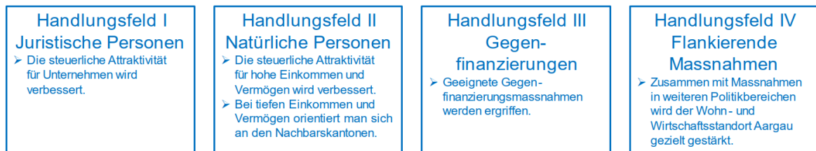
Abbildung 1: Handlungsfelder Steuerstrategie 2022–2030

Anhand der definierten Handlungsfelder wurden die strategischen Ziele pro Handlungsfeld ausgearbeitet und mögliche Massnahmen anhand von Leitsätzen aufgezeigt. Der Grosse Rat hat die insgesamt 20 Leitsätze beraten und mit Änderungen genehmigt (GRB Nr. 2023-0806 und GRB Nr. 2023-0808). Der Planungsbericht mit den verabschiedeten Leitsätzen zeigt, wie die Steuerpolitik in den nächsten zehn Jahren aussehen soll.