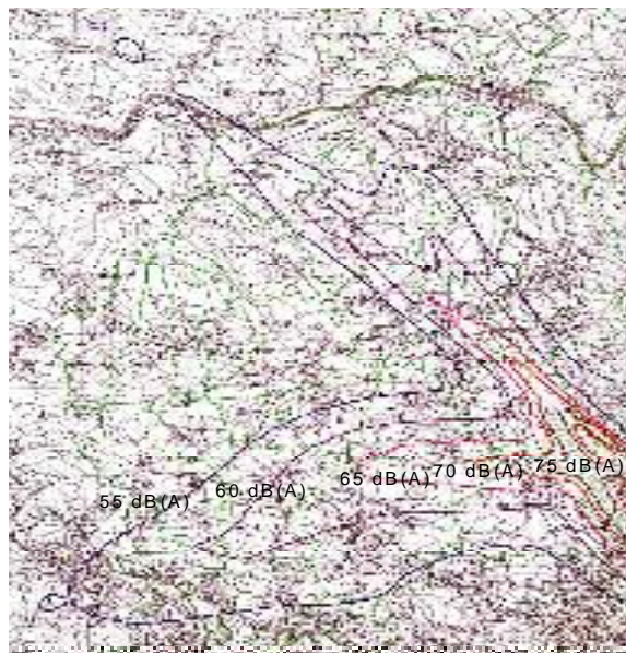
Abb. 2: Fluglärmkarte Tag, Stand 1997 (Ist-Zustand Z0)

Die räumliche Nähe zum Flughafen Zürich-Kloten ist kein Garant für ein überdurchschnittliches Wachstum der Bevölkerungs- und Arbeitsplatzzahlen. Damit eine Region vom Flughafen profitieren kann, sind eine gute Erschliessung und wirtschaftliche Beziehungen notwendig. Es muss somit Ziel sein, die verkehrliche Anknüpfung des Limmattals und des Zurzigebietes noch weiter zu fördern. Mit dem Flugzug hat der Aargau erste Schritte unternommen.