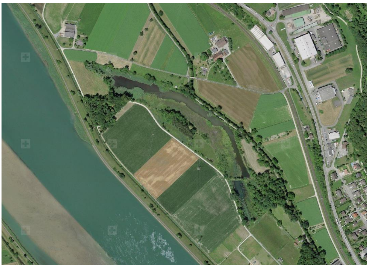
Klingnauer Stausee im Bereich des anzupassenden Gebiets «Machme-Grien»