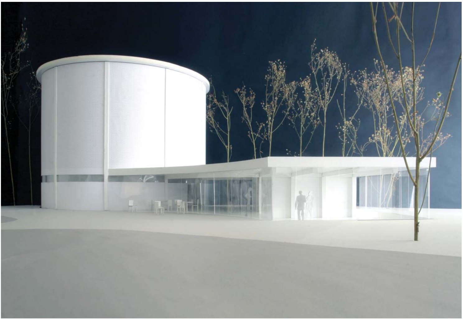
ANSICHT VOM PARK, ARBEITSMODELL 1:20