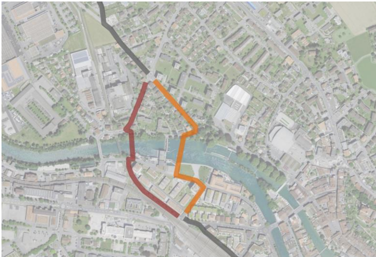
Linienführung im Abschnitt Selve-Schwäbis: Die beiden Bestlösungen «Variante Rot» und «Variante Orange».

Bevor ein Variantenentscheid gefällt werden kann, muss geklärt sein, ob eine substantielle Reduktion der Verkehrsbelastung auf der Schwäbisstrasse möglich ist (was die Variante «Rot» aufwerten würde) und ob eine Aarequerung oberhalb des Wehrs mit dem Bundesinventar der schützenswerten Ortsbilder (ISOS) in Einklang gebracht werden kann (was die Prozessrisiken der Variante «Orange» reduzieren würde). Die Klärung dieser Fragen ist im Gang. Aussagen, wann der Entscheid gefällt werden kann, sind schwierig, da verschiedene stadtexterne Stellen beteiligt sind.