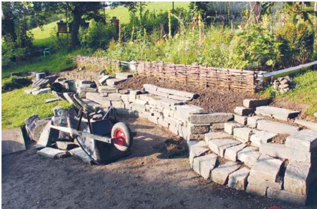
Bau einer Trockenmauer

Bei Fragen zur gezielten Förderung von bestimmten Tier- oder Pflanzenarten helfen Fachpersonen aus den Bereichen Biologie oder Zoologie gerne. Für Neuanlagen und Umgestaltungen empfiehlt es sich, bereits bei der Planung ein Landschaftsarchitekturbüro oder einen Gartenbaubetrieb beizuziehen und ein Konzept zur Umgebungsgestaltung zu erstellen.