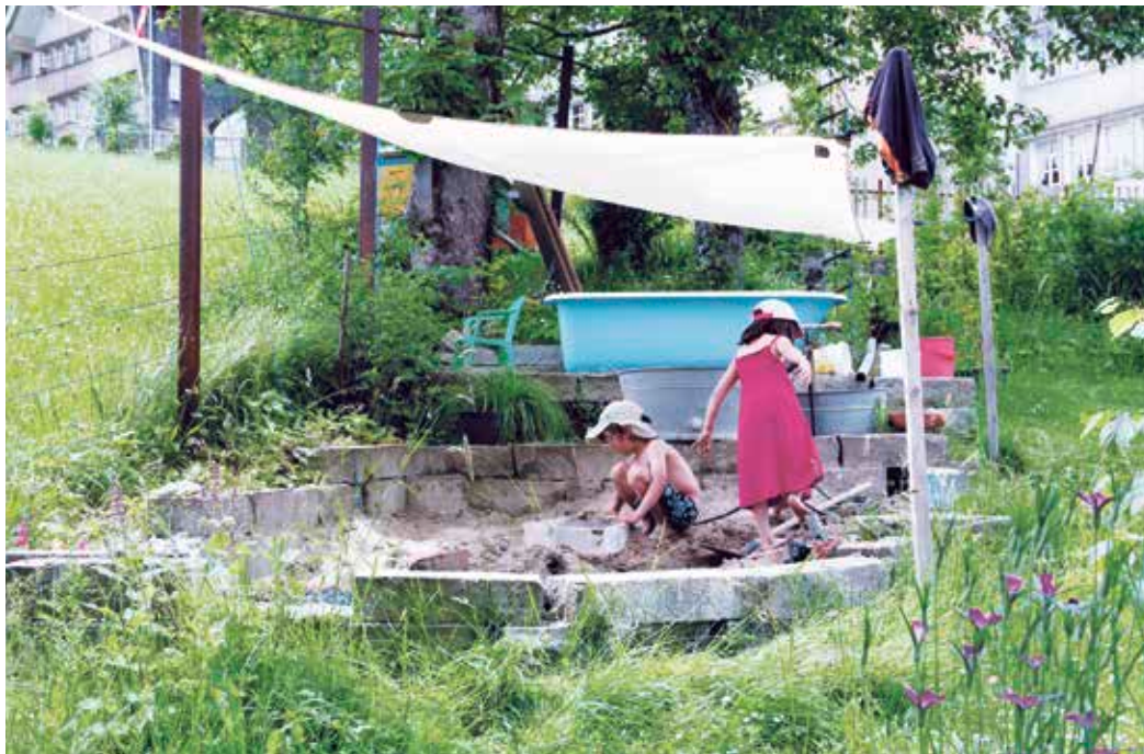
Kinder genießen den Naturgarten

Grünflächen in unseren Siedlungen sind auch Lebensraum für zahlreiche Pflanzen und Tiere: Sie dienen als Trittsteine zur Verbreitung, als Nahrungsgrundlage, Versteckmöglichkeiten und Nistplatz. Entsprechend wichtig sind diese Flächen für den Erhalt der Biodiversität. In diesem Leitfaden finden Sie verschiedene Gestaltungselemente für eine naturnahe und tierfreundliche Umgebung und konkrete Tipps zur Umsetzung und Pflege.