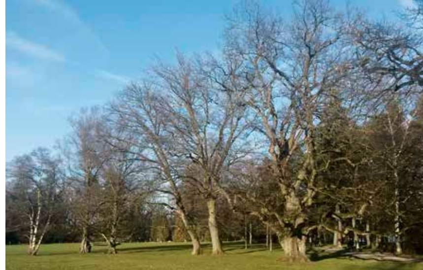
Moorbirken im Bonstettenpark