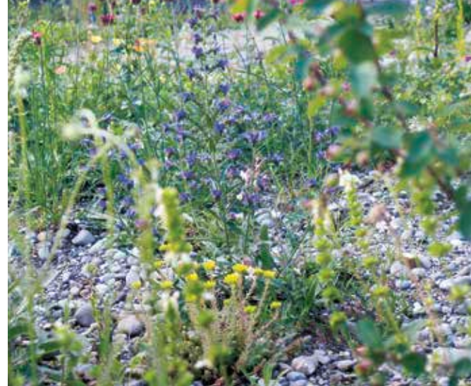
Langsam einwachsende Ruderalfläche