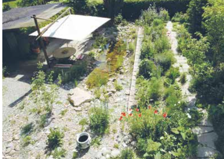
Nutzgarten mit Kies und Weiher