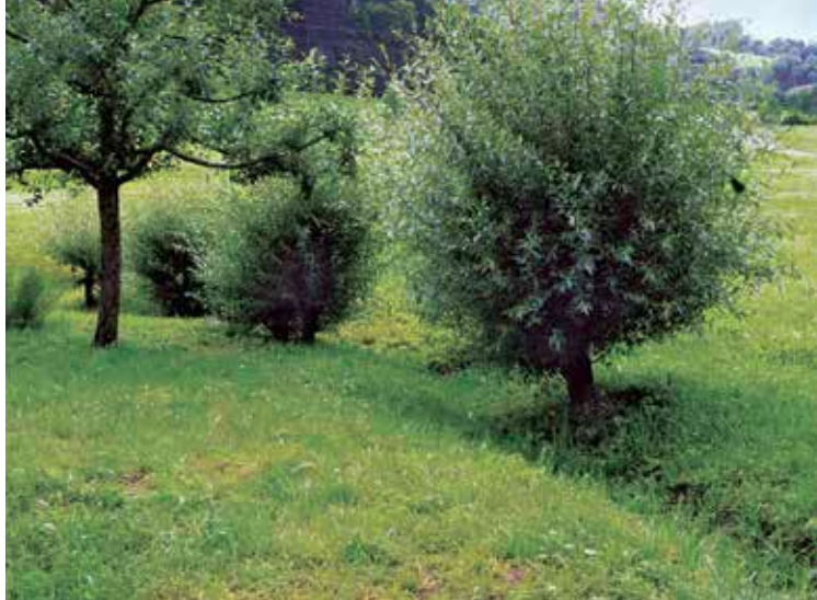
Kopfweiden an Bachlauf