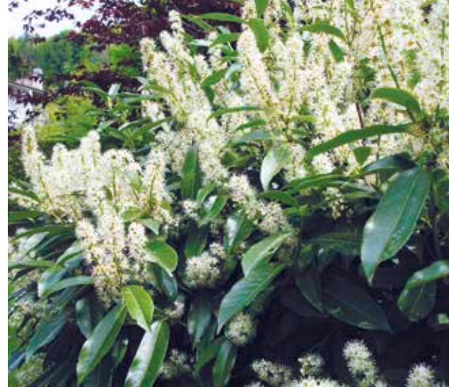
Kirschlorbeer, ein hartnäckiger Neophyt