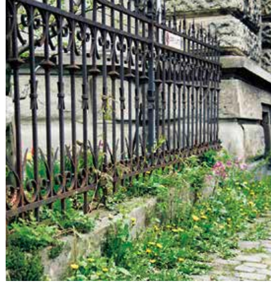
Spontanvegetation im Randbereich