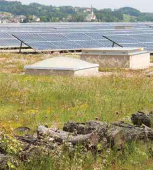
Solarpanels kombiniert mit Dachbegrünung