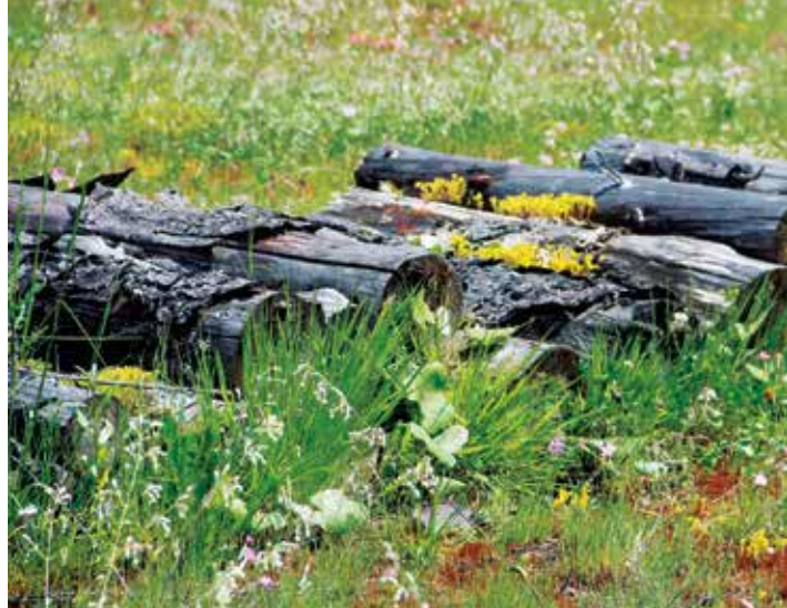
Totholz mit Flechten