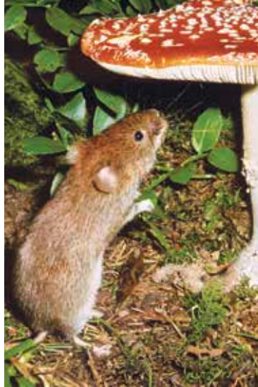
Maus mit Fliegenpilz