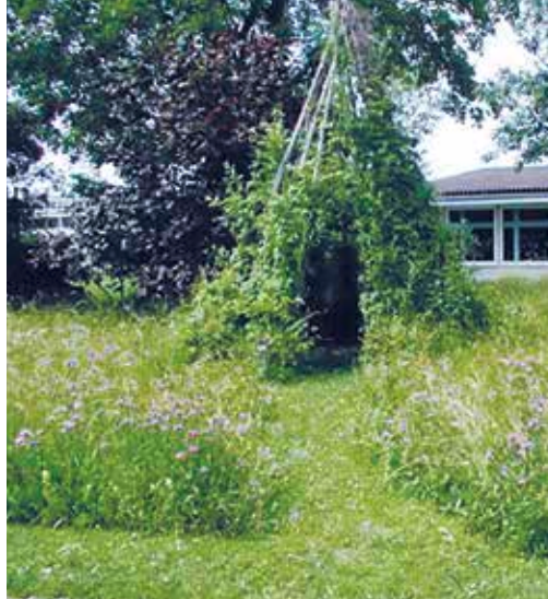
Hopfenzelt mit ausgemähtem Zugangsweg