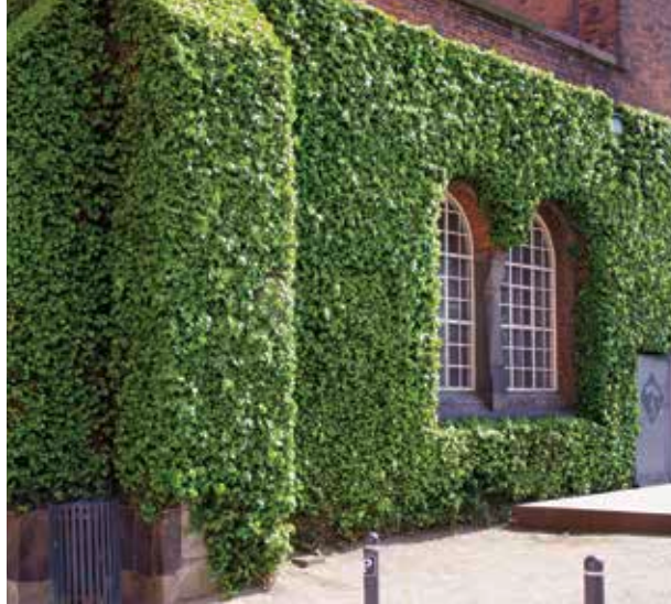
Efeu mit Begrenzungsschnitt