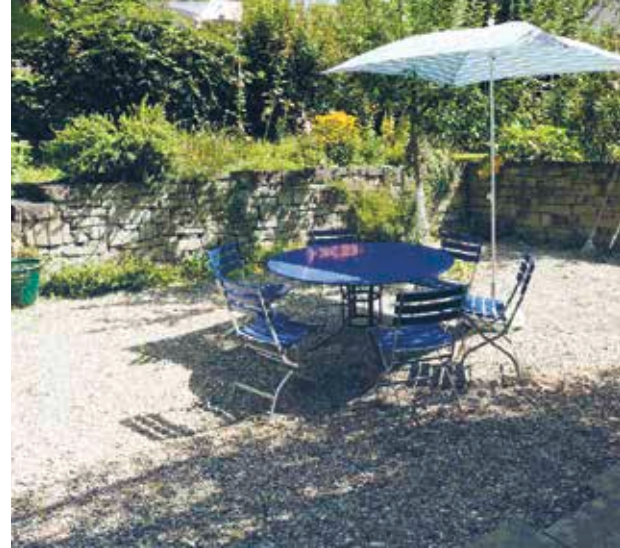
Gartensitzplatz mit Trockenmauer