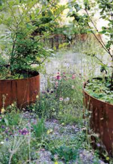
Einzelsträucher neben Ruderalfläche