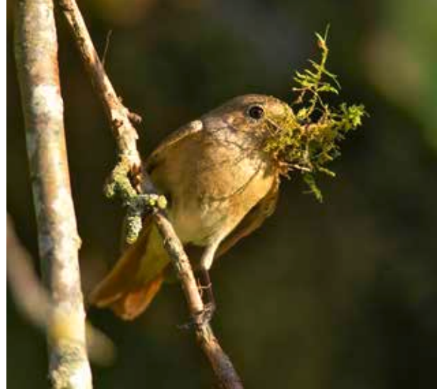
Gartenrotschwanz mit Nistmaterial