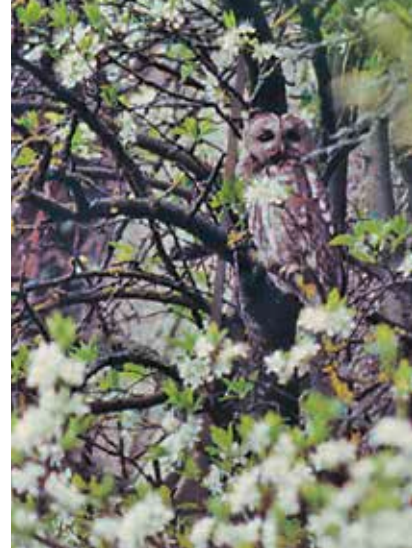
Waldkauz in Birnenspalier