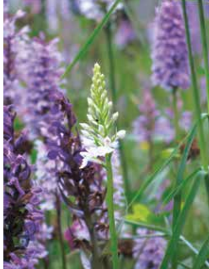
Orchideen auf Flachdach