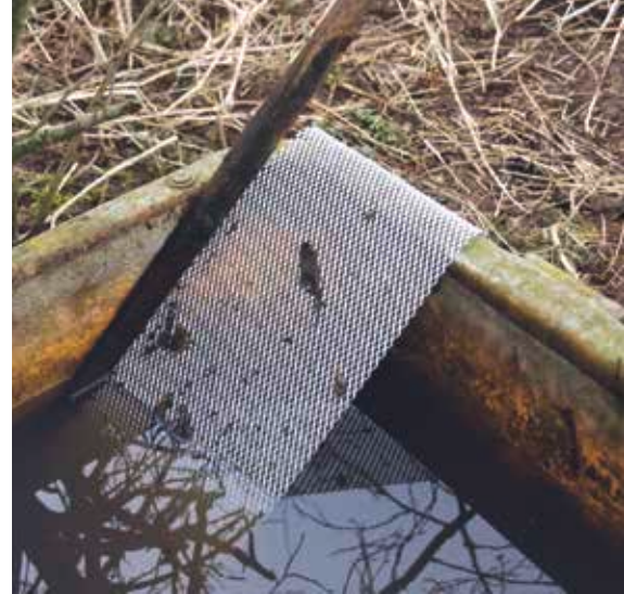
Notausstieg aus Wasserbehälter