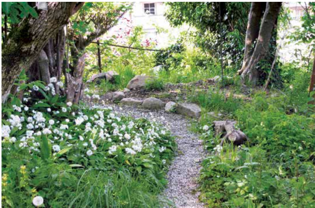
Weg mit Bärlauch

Lebensraumtypen lassen sich aufgrund ihrer Bodenbeschaffenheit, ihrer Lage und ihrer Pflanzengesellschaft unterscheiden. Viele Tierarten sind auf verschiedene, kleinräumig nebeneinander vorkommende Lebensraumtypen angewiesen. So besucht der Distelfink gerne den Siedlungsraum, gerade wegen der hier vorkommenden Disteln, Karden und Wildsträucher. Zur Brutzeit ist er jedoch auf Bäume angewiesen, weil er sein Nest hoch über dem Boden anlegt. Die Zauneidechse liebt Trockenmauern und benötigt daneben Wiesen mit Blütenpflanzen und vielen Insekten. Für die Gestaltung einer naturnahen Umgebung lassen sich vereinfacht die nachfolgend beschriebenen Lebensraumtypen, Seiten 8 – 11, unterscheiden.