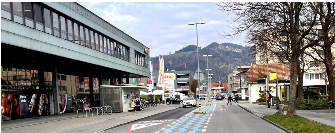
Schulstrasse, Foto Planungsamt, April 2025

Die Strassenräume in den Thuner Wohnquartieren müssen eine Vielzahl von Anforderungen erfüllen. Die fortschreitende qualitative Innenentwicklung, vielfältiger werdende Mobilitätsnutzungen, gesellschaftliche und stadtklimatische Anforderungen und Bedürfnisse bei gleichzeitiger Sicherstellung der Sicherheit für alle Verkehrsteilnehmenden stellen neue Ansprüche an diese wichtigen Stadträume. Die aktuelle Gestaltung und Ausprägung der Strassenräume werden diesen Anforderungen nicht mehr länger gerecht. Um die Wohn- und Lebensqualität in den Wohnquartieren zu verbessern und die Strassenräume als nutzbare, attraktive öffentliche Räume zu gestalten, soll das Betriebs- und Gestaltungskonzept Wohnquartiere (BGK Quartiere) entsprechende Grundlagen liefern. Auf übergeordneter Ebene werden Gestaltungsprinzipien und Grundsätze in Abhängigkeit der unterschiedlichen Strassenkategorien erarbeitet, welche künftig stadtweit in den Wohnquartieren zur Anwendung kommen sollen. Im ausgewählten Gebiet Dürrenast – Neufeld werden konkrete Massnahmen für die Umsetzung erarbeitet. Die Erarbeitung des BGK wird durch einen umfassenden partizipativen Prozess begleitet.