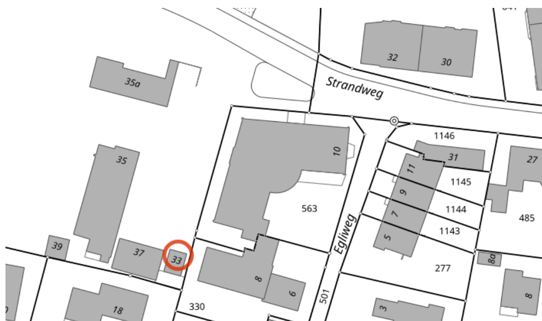
Abb. 2, Detail Standort TS Progressia

Die Ausführung der Arbeiten ist für 2022/23 vorgesehen.