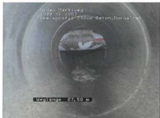
Abbildung 1: Querung durch Kanalisation

Haltung Nr. 1087 bis 1099 (bcb 4), TV-Berichte Nr. 42 + 43 Kabelschutzrohr quer durch die RWL NBR DN 250 mm