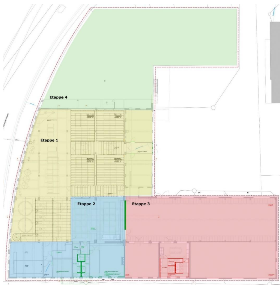
Übersichtplan Etappen 1-4