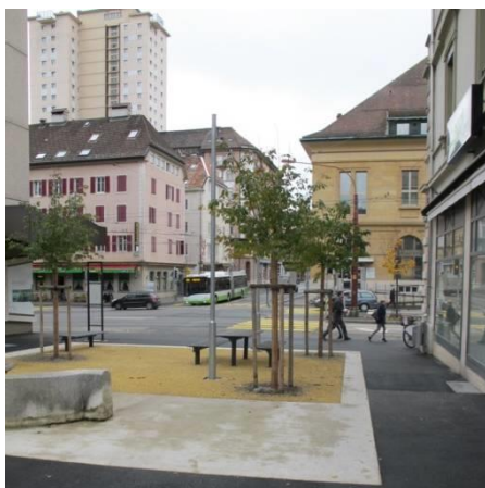
Aménagements rue de l'avenir : accroche visuelle depuis et vers la place de la Gare et l'avenue Léopold-Robert

Le projet de réaménagement des rues de l'Avenir et de la Fontaine propose un aménagement homogène et qualitatif. La première tranche (avenue Léopold-Robert – rue de la Serre) est d'ores et déjà construite et joue aujourd'hui son rôle de nouvel espace de rencontre (terrasse) et d'appel visuel depuis l'avenue Léopold-Robert à un cheminement destiné aux modes doux.