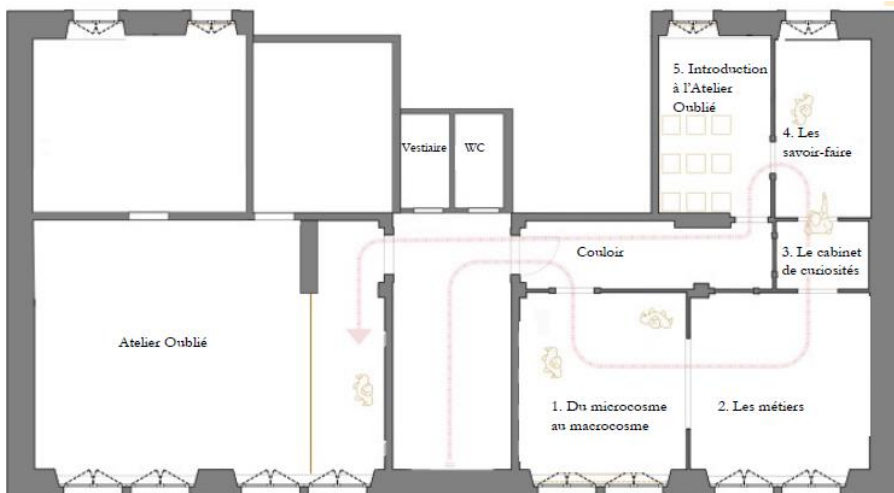
Plan de l'étage et déambulation (étape de réflexion)