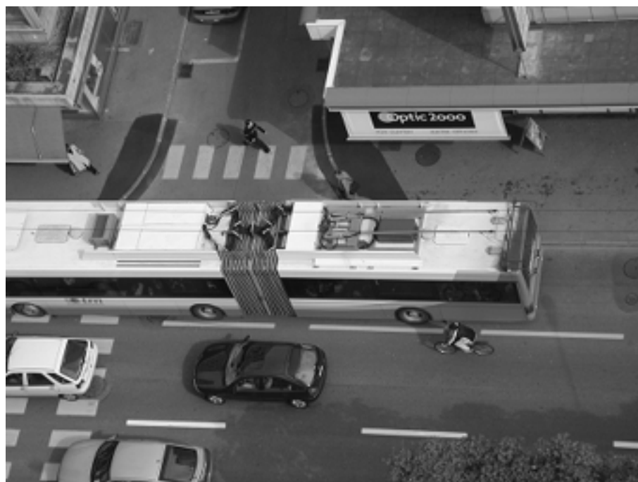
Les différents modes de transports en ville ; la place faite aux piétons et cycliste consiste en espaces résiduels...

Or, il n'est pas aisé aujourd'hui d'être un utilisateur vulnérable de l'espace public – piétons ou cycliste – car l'espace laissé à leur disposition est souvent portion congrue, relégué à être un espace résiduel.