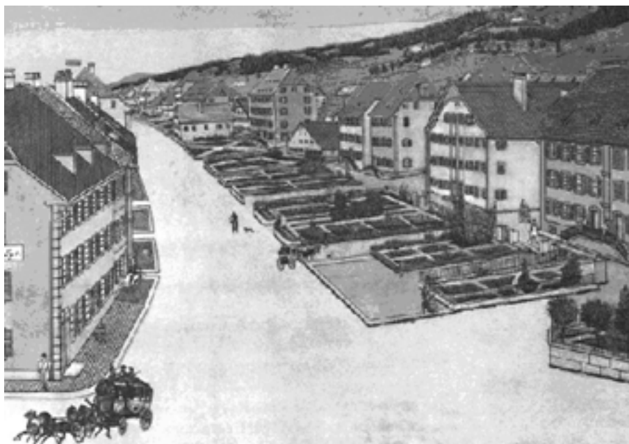
La Grand-Rue vers 1850 environ, avant qu'elle ne prenne le nom, en 1862, de rue Léopold-Robert.

La Grand-Rue menait directement à la Mère-Commune. Elle occupait alors ce qui est aujourd'hui l'artère sud de l'avenue Léopold-Robert, l'artère nord étant, elle, occupée par les jardins familiaux des maisons qui composaient le front nord de la rue. Elle gardera cet aspect jusque dans la seconde moitié du XIX ème siècle environ.