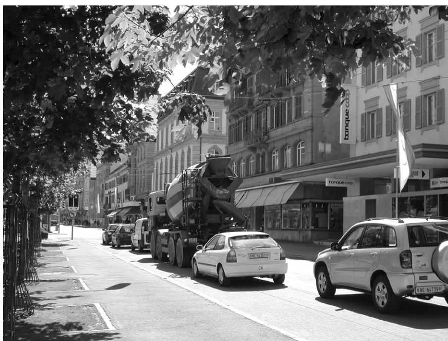
L'avenue Léopold-Robert au niveau de la place Espacité au début des années '00.

Depuis le milieu des années '90, on assiste à un changement de paradigme qui consiste non pas à mener une politique anti-voiture mais bien à rééquilibrer la part de l'espace public dédié à chaque utilisateur.