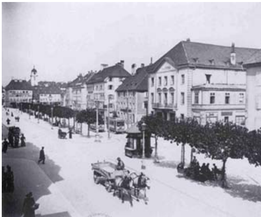
La rue Léopold-Robert aux alentours de 1900, avec au premier plan le Théâtre et en arrière plan le Grand-Temple. On distingue également au centre de l'image un tramway et on devine la Grande-Fontaine.

La première moitié du XX ème siècle a vu apparaître bon nombre d'innovations en matière de mobilité notamment puisque les chars attelés ont progressivement côtoyé les tramways puis ceux-ci ont cédé leur place aux automobiles.