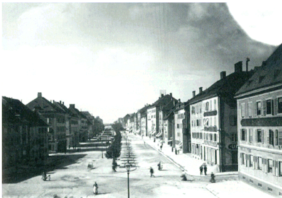
La rue Léopold-Robert avec ses deux artères et sa rangée d'arbres en 1894 (la prise de vue a été effectuée depuis l'immeuble Neuve 11).

En 1888, la Grande-Fontaine est érigée à l'extrémité est de la rue Léopold-Robert pour marquer l'arrivée de l'eau potable en ville de La Chaux-de-Fonds.