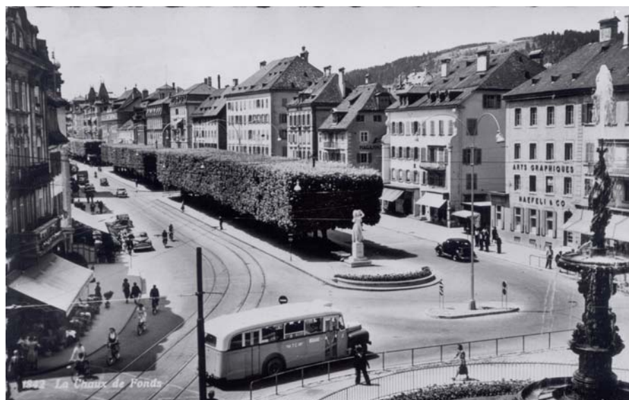
L'avenue Léopold-Robert vers 1950, avec au premier plan la Grande-Fontaine et la sculpture de Léon Perrin dédiée à Léopold Robert.

Les années '70, '80 et le début des années '90 ont connu tout d'abord l'avènement de l'automobile puis celui du tout voiture avec un Pod à trois voies notamment. A cette période, l'espace public n'est abordé qu'au travers d'une vision technique centrée avant tout sur la voiture. L'espace dédié aux autres utilisateurs de la rue - personnes âgées, parents avec une poussette, écoliers, cyclistes, transports en commun - consiste en espaces résiduels abandonnés ou inutilisables par les voitures.