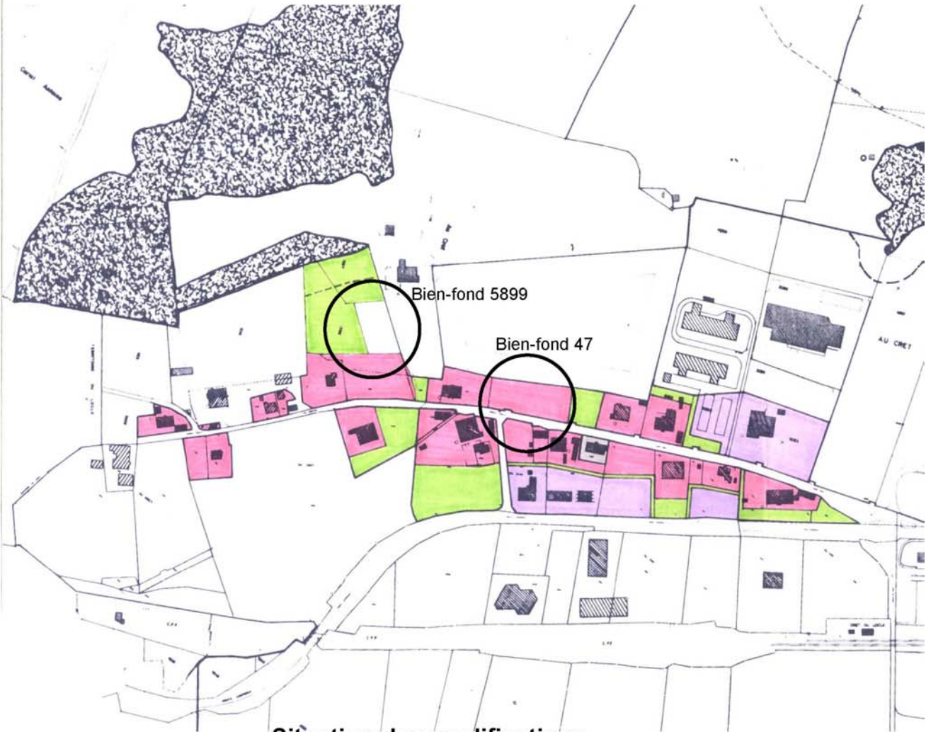
Situation des modifications