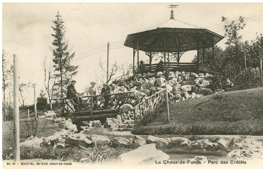
Carte postale des collections du Musée d'histoire