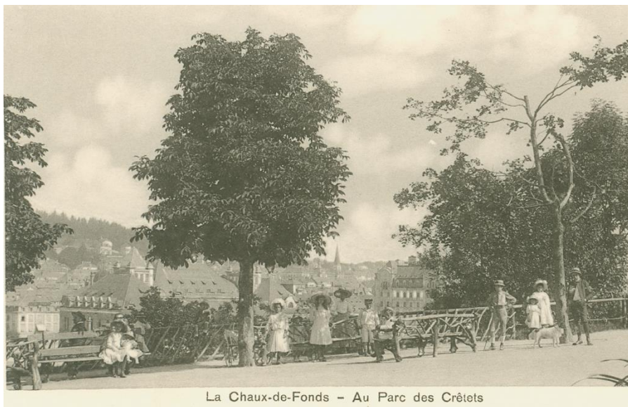
Carte postale des collections du Musée d'histoire

L'ensemble du parc des Crêtets constitue un témoignage de la modernité de La Chaux-de-Fonds au tournant du siècle et de la volonté d'amener de la nature dans une ville dont le plan Junod ne prévoyait, outre les jardins privés, aucun espace vert commun.