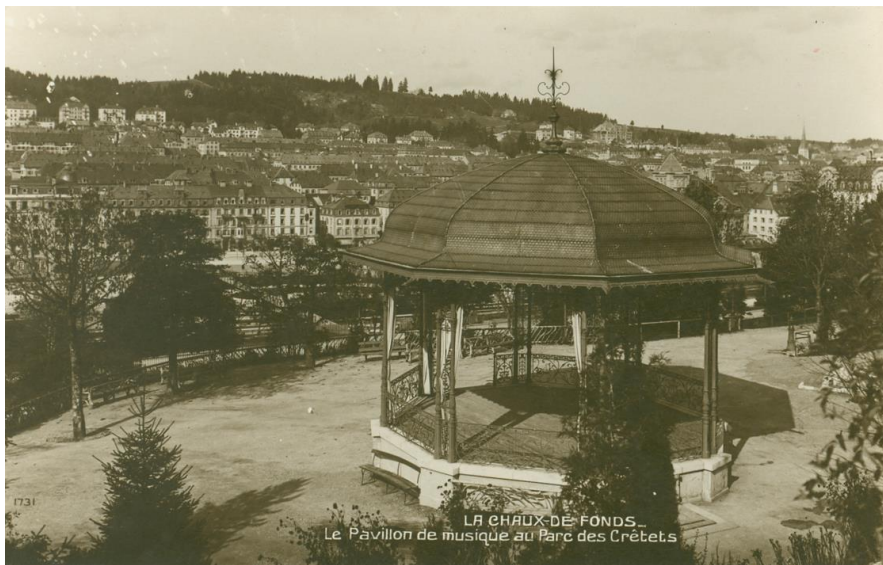
Carte postale des collections du Musée d'histoire

L'évidence et la reconnaissance de la substance historique et patrimoniale du parc des Crêtets ont guidé les réflexions quant à son réaménagement.