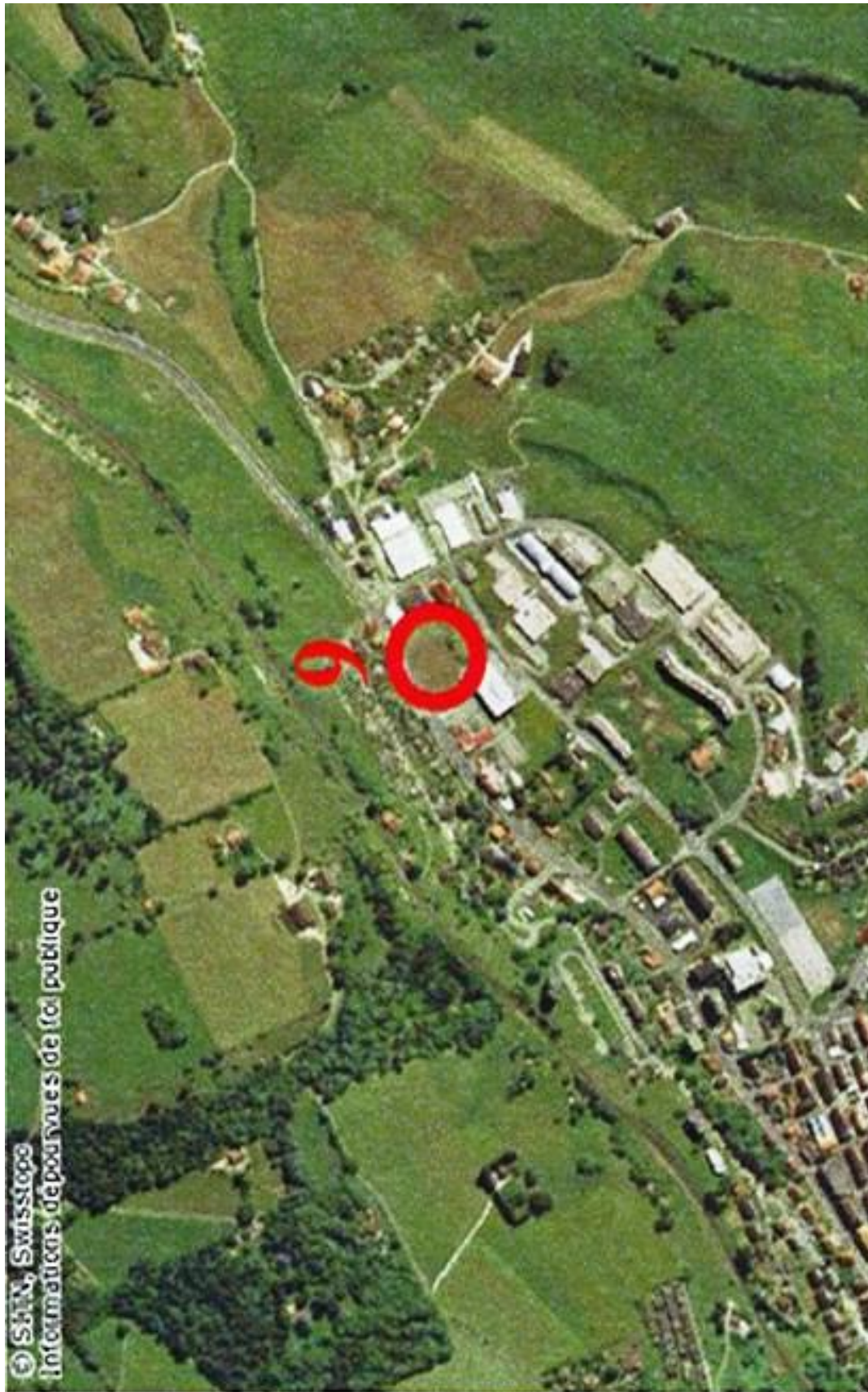
est de la Ville du Locle