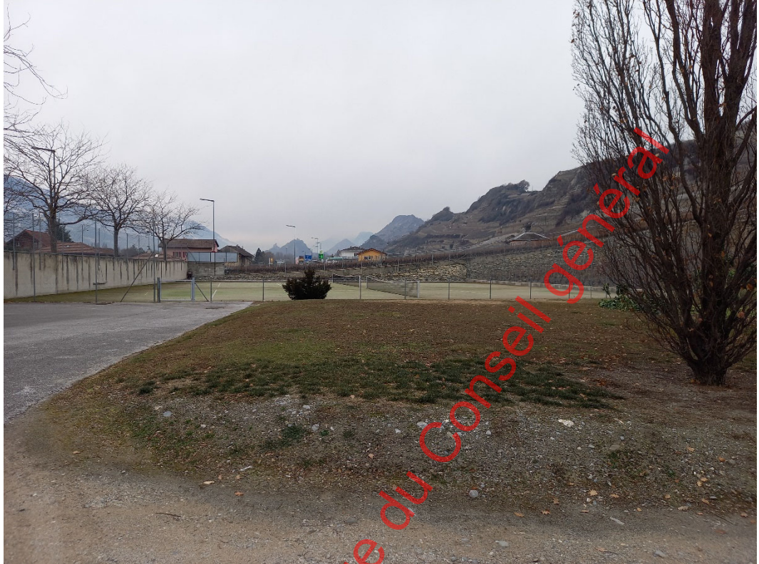
Photo 2 : partie de la parcelle 14220 occupée actuellement par des terrains de tennis, des places de stationnement et un remblai.

La parcelle 7506 (3227 m 2 ) afin de mettre en conformité l'utilisation réelle avec l'affectation légale, c'est-à-dire une utilisation hôtelière, Elle est actuellement affectée « à cheval » sur deux zones à bâtir, la zone de village et hameau à l'est et la zone d'habitat individuel de plaine à l'ouest.