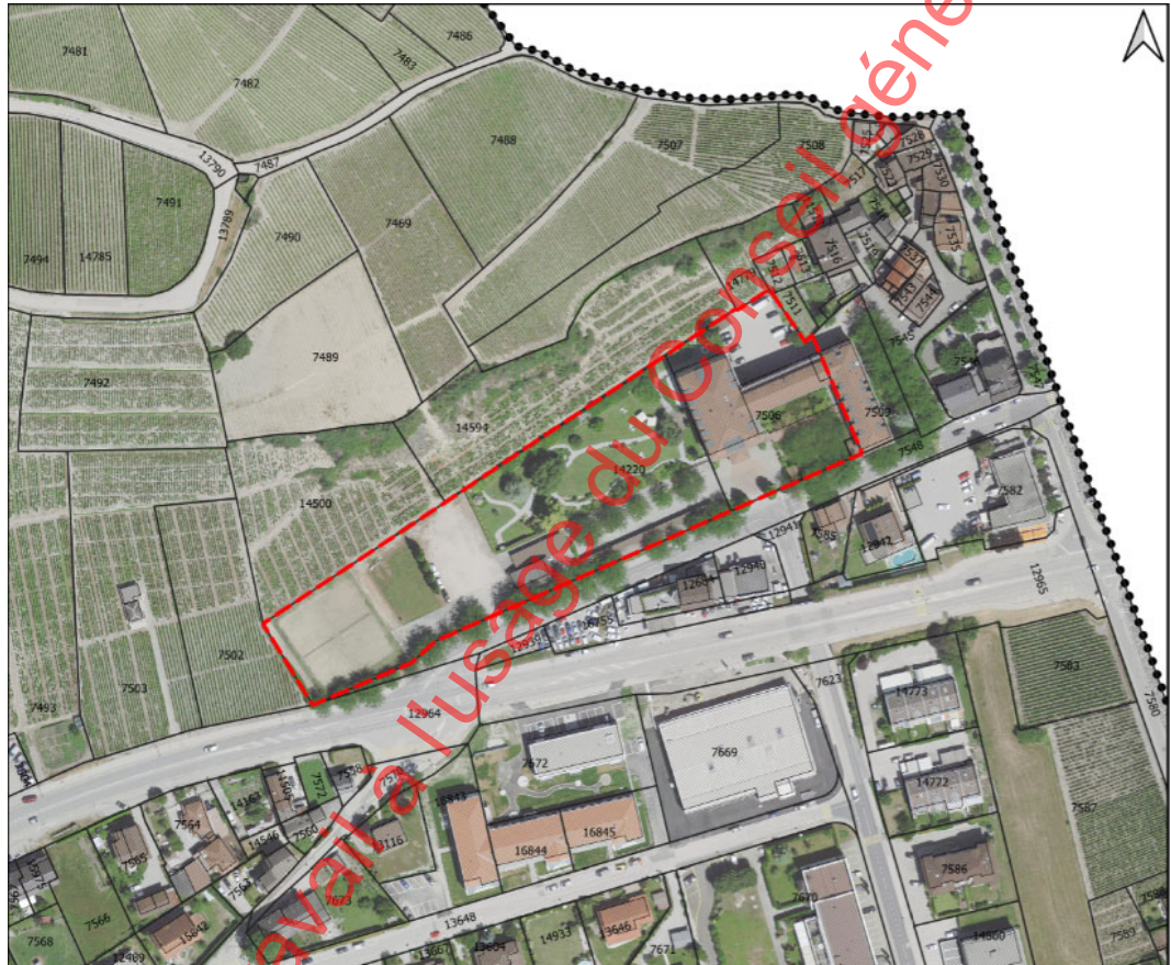
Carte 1 : orthophoto et périmètre de la modification

La commune de Sion souhaite adapter et modifier partiellement son PAZ en vigueur dans le secteur situé à l'ouest de l'Hôtel des Vignes à Uvrier.