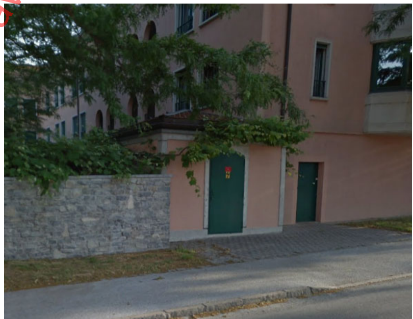
Photo 3 : parcelle 14780 occupée par un petit bâtiment destiné à l'électricité.

La parcelle 14780 est une petite parcelle contenant un petit bâtiment « électrique ».