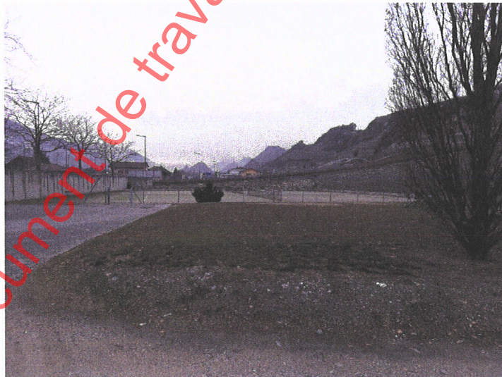
Photo 1 : partie de la parcelle 14220 occupée actuellement par des terrains de tennis, des places de stationnement et un remblai.

L'affectation de la parcelle 14220 (8'000 m 2 ) est modifiée en raison du potentiel nécessaire au développement futur d'équipements et infrastructures en lien avec l'exploitation hôtelière. Elle est actuellement affectée en zone d'habitat individuel de plaine.